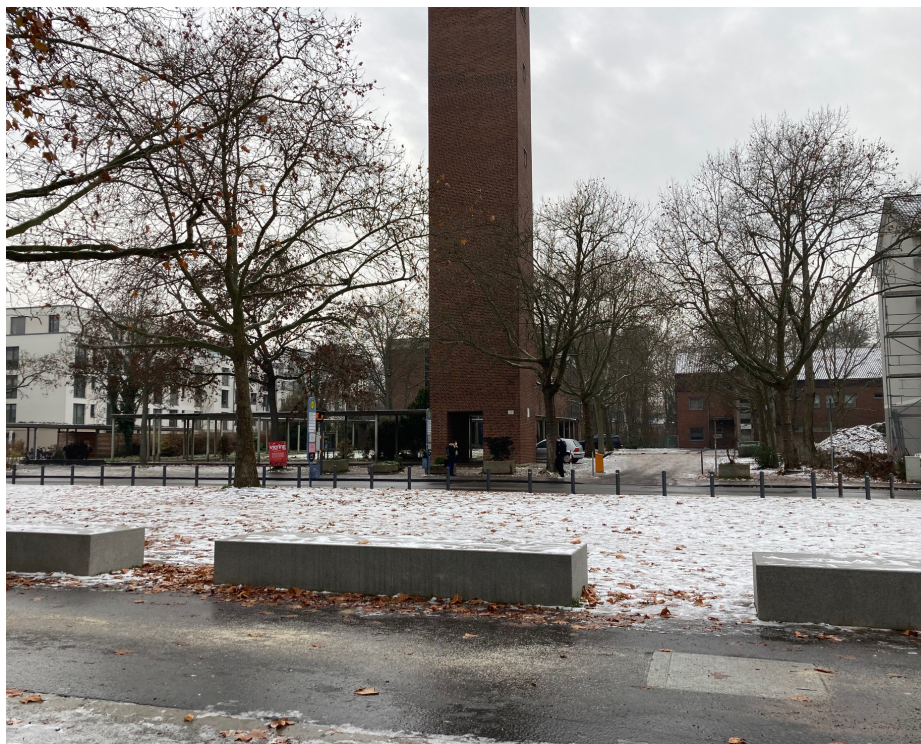
Ansicht von der Schule aus