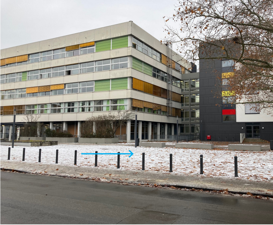
Ansicht von der gegenüberliegenden Straßenseite