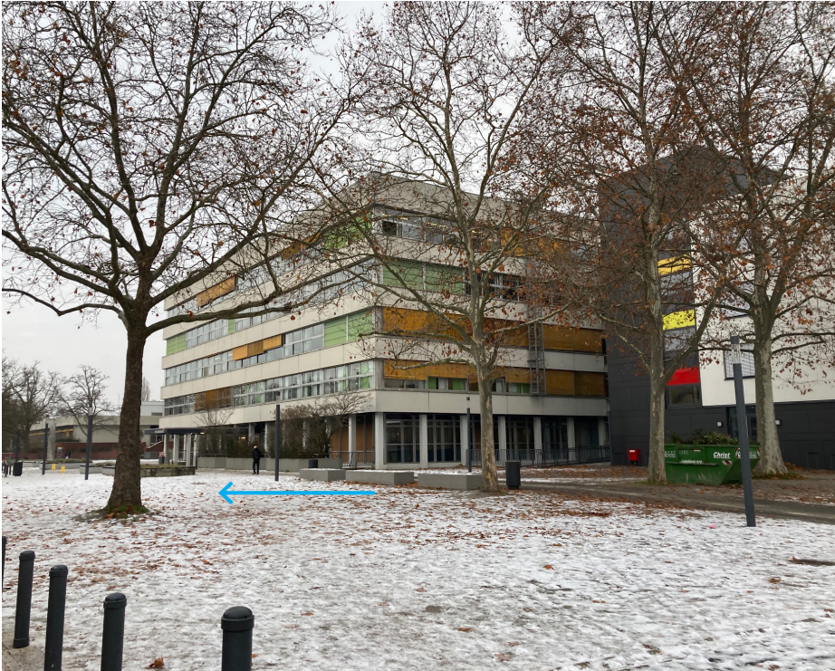
Ansicht der BBSI mit Vorplatz