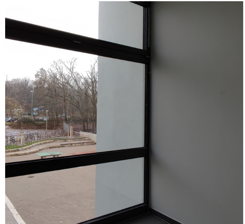
Außen- und Innenwand getrennt von einer Glasfront