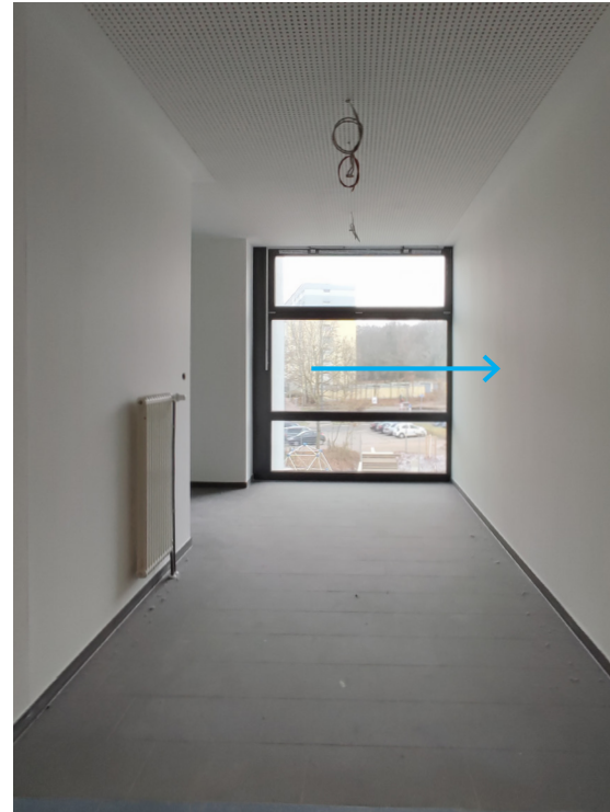
Treppenhaus innen, 2. OG rechte wand ist für Kunst am Bau vorgesehen