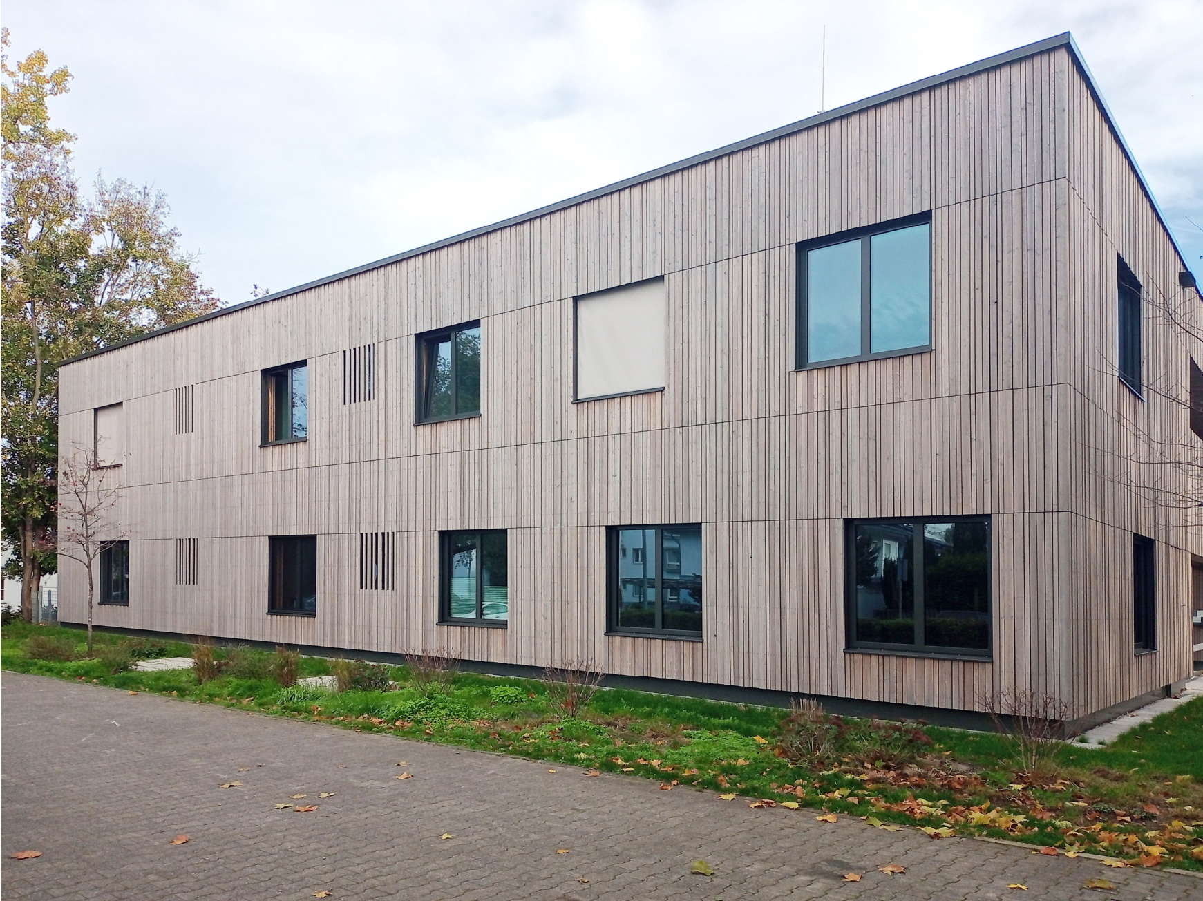
Ansicht Kita mit Fläche für Kunst am Bau (West)