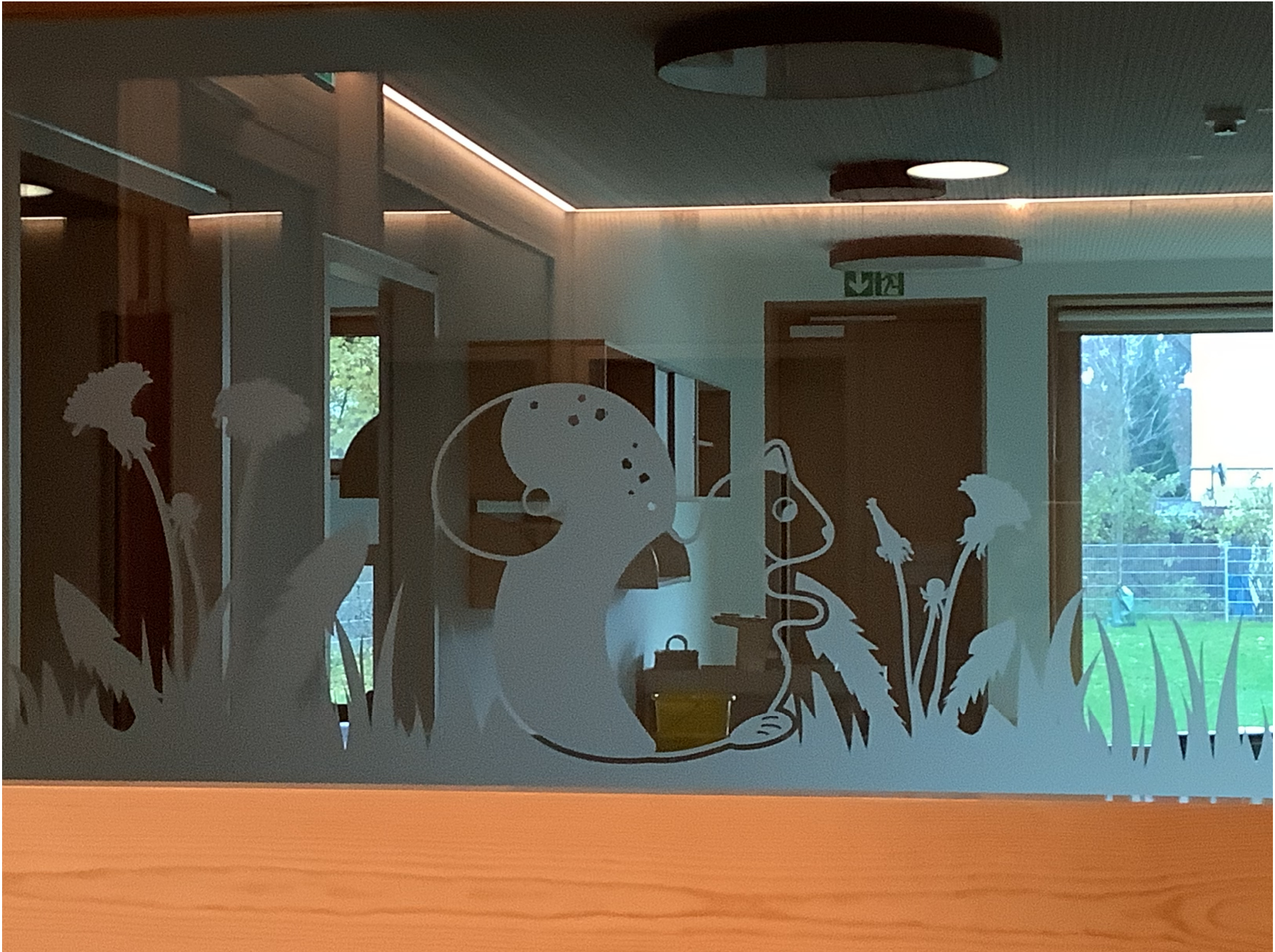
Beispiel für die Einbindung der Gruppensymbole im Innenraum: Eichhörnchen-Gruppe