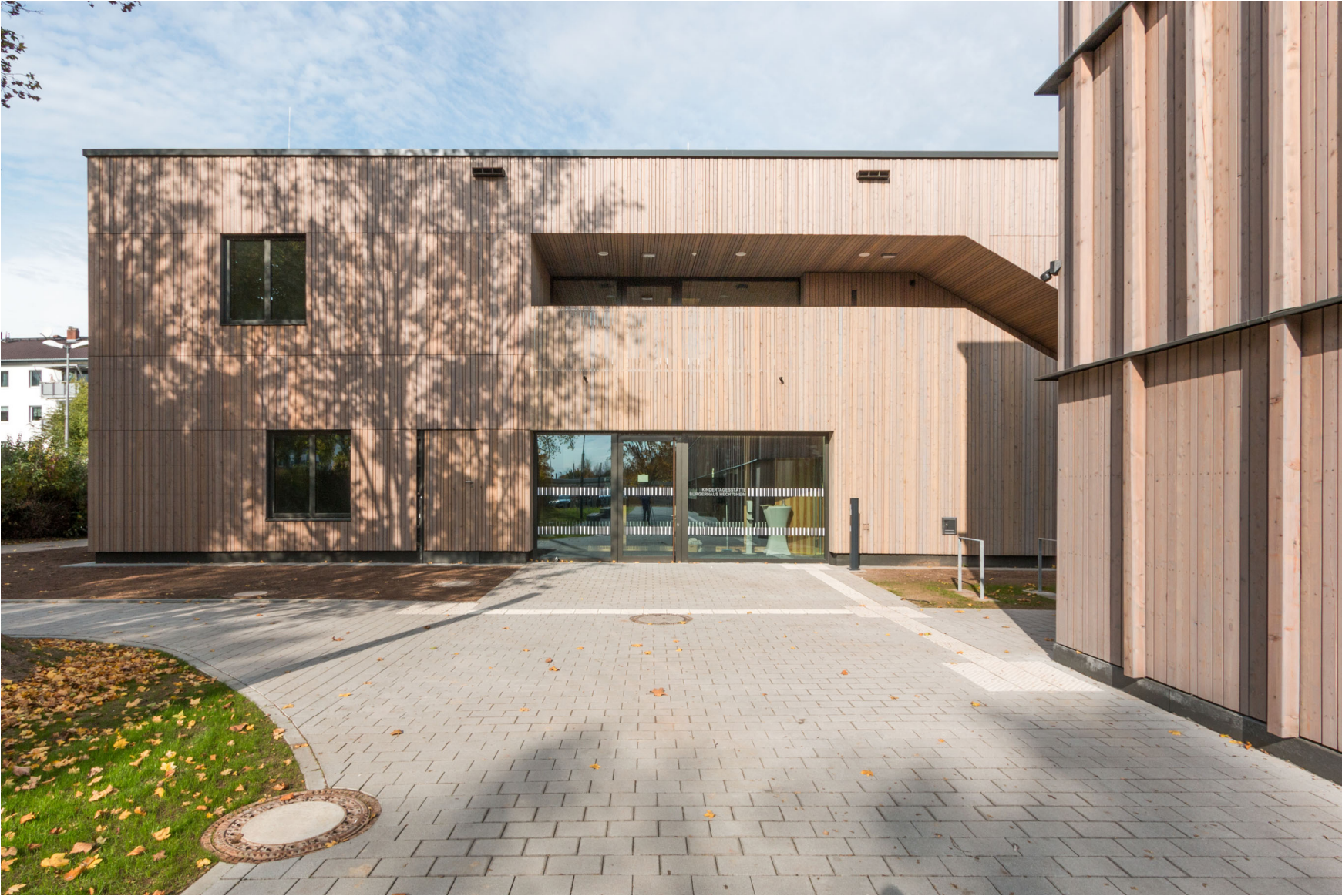
Ansicht Haupteingang Kita (Süd)