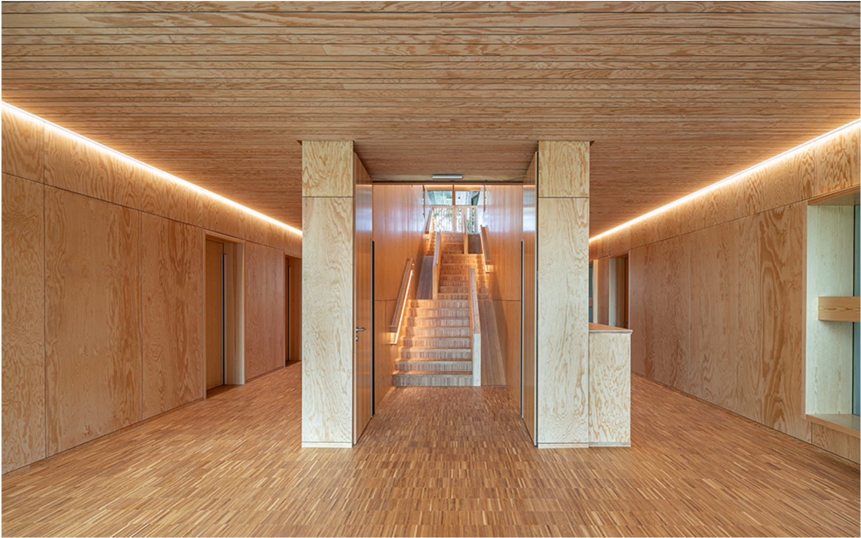
Flur im Erdgeschoss mit Spieltreppe