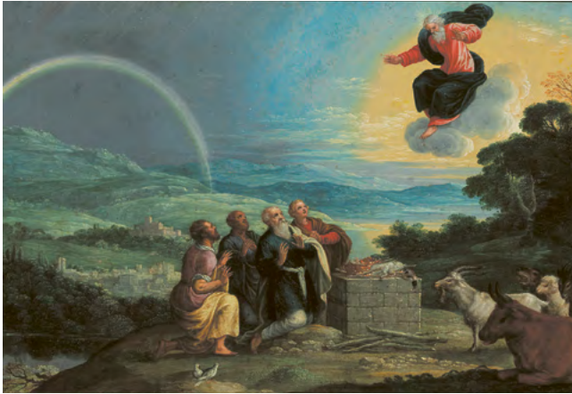
Johann König, Das Opfer des Noah nach der Sintflut , 1629