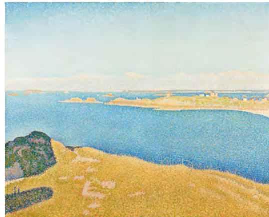
Paul Signac, Das Meer, Opus 211 , 1890