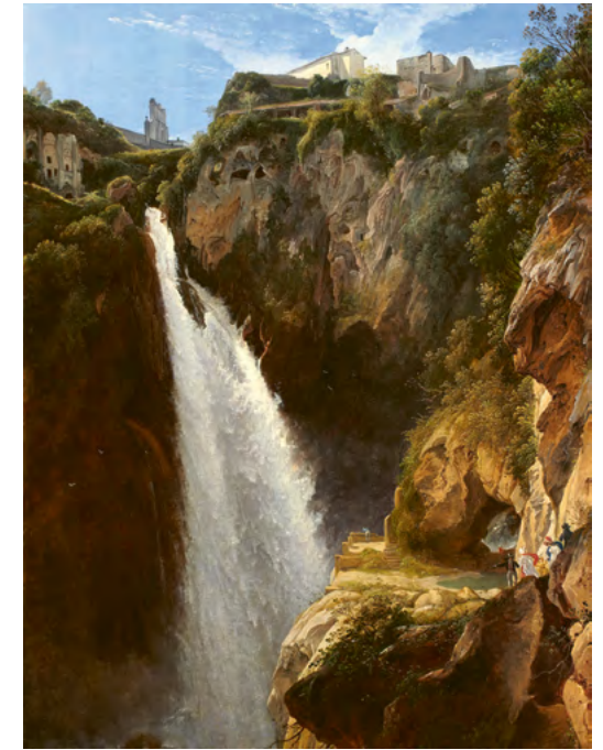
Johann-Martin von Rhoden, Die Kaskaden von Tivoli , 1825