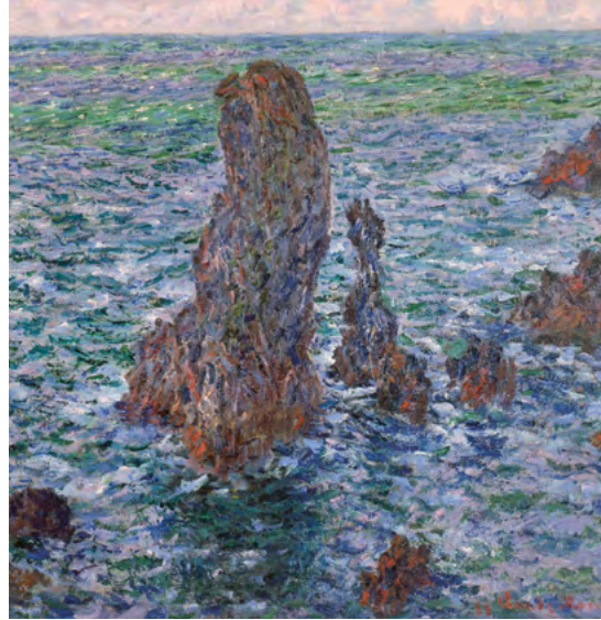
Claude Monet, Die Felspyramiden von Port-Coton , 1886