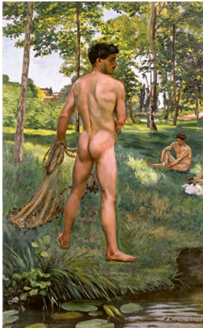
Frédéric Bazille, Fischer mit Netzen , 1868