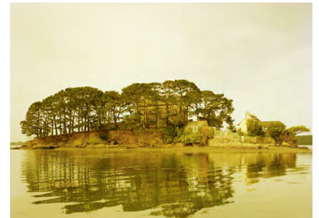
Elger Esser, Ile d'Arun , 2019 © VG Bild Kunst Bonn, 2024