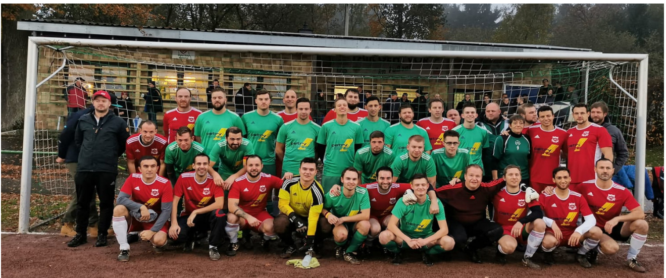
Foto: Die zweite Mannschaft in grün, die dritte Mannschaft in rot

einem Meisterschaftsspiel auf einander. Schon die Ankündigung in den sozialen Medien sorgte für eine gewisse Brisanz: Spitzenspiel und Sternstunde des Fußballs! Fußballerische Brillanz, technische Kunststücke, taktische Finessen und beinharder Kampfgeist gibt es an Allerheiligen auf dem Bieberner Hartplatz zu sehen. Und das dieses Mal ausnahmsweise auf beiden Seiten des Platzes. Die DRITTE fordert den Spitzenreiter der C-Klasse Süd, die ZWOTE, um die beste Ausgangslage für die Tabellenführung heraus.