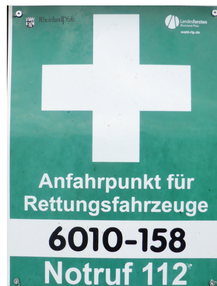
Rettungspunkt unterhalb dem Sportplatz