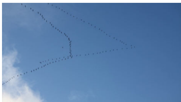
Rückkehr der Kraniche

Das Frühjahr mit dem Frühlingsanfang am Sonntag, den 20. März, hat auf dem Hunsrück Einzug gehalten. Kraniche als Frühlingsvorboten kehrten aus den Winterquartieren in Südeuropa und Nordafrika zurück und überflogen den Hunsrück. Schneeglöckchen, gelbe Krokusse und blühende Weidekätzchen kündeten von der neuen Jahreszeit. Am 27. März wurden die Uhren wieder auf die Sommerzeit umgestellt. Noch 2019 hatte das EU-Parlament die Abschaffung der Zeitumstellung beschlossen. Die Realisierung gestaltet sich schwierig. Die 27 Mitgliedstaaten der Europäischen Gemeinschaft können sich gegenwärtig nicht einigen, ob dauerhaft die Sommer- oder die Winterzeit eingeführt werden soll. Und somit wird die Zeitumstellung uns noch lange Zeit begleiten. WRo