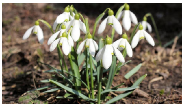
Die ersten Schneeglöckchen im Garten