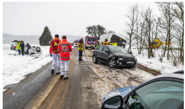
Unfall bei Schneeglätte auf der K18 zwischen Biebern und Nannhausen