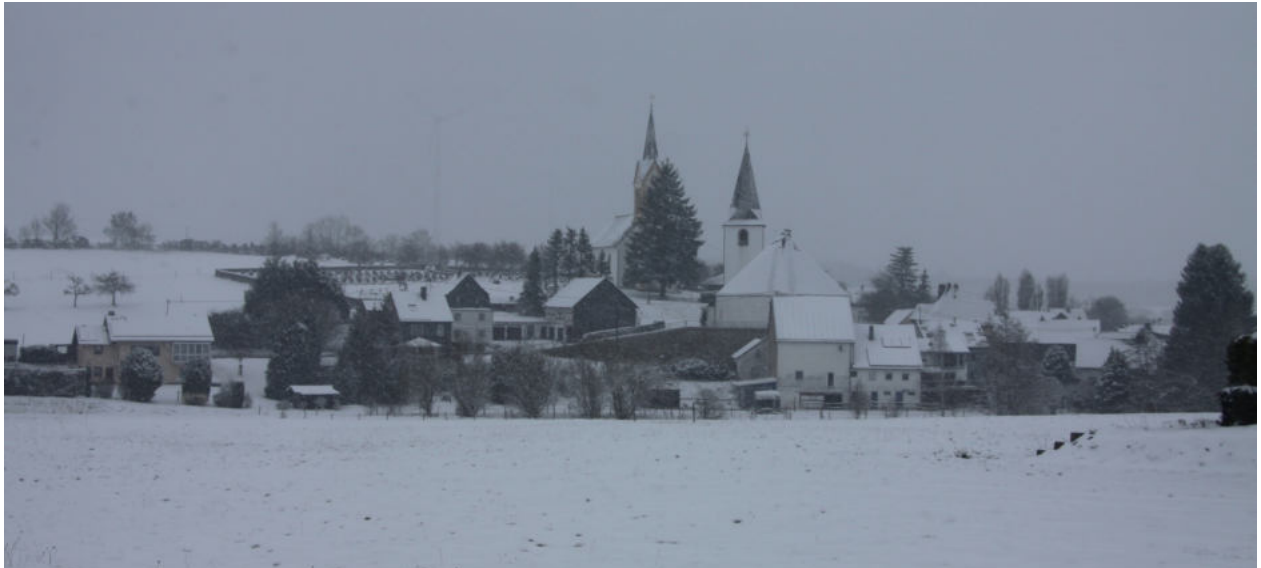
Am 2. April 2022 war der Schiederich mit einer weißen Schneedecke überzogen