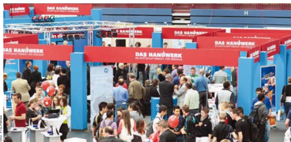
Großer Andrang bei den HwK-Ausbildungsberatern und ihrer aktuellen Lehrstellenbörse

Gemeinsam mit der Kreishandwerkerschaft Mittelrhein und ihren Innungen lud die HwK dazu ein, in die Welt des Handwerks einzutauchen. Für pfiffige Köpfe gab es ein Handwerksquiz, bei dem man ganz nebenbei jede Menge Interessantes über das Handwerk erfährt. Auf der großen Bühne