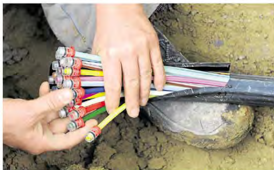
Während die VG Rüdesheim Anfang des Jahres die flächendeckende Internetversorgung sichergestellt hat, gibt es im Kreis immer noch Gemeinderäte, in denen man vom Netz quasi abgeschnitten ist. „Unhaltbar“, finden die Lile-Teilnehmer und fordern: einheitlicher und vom Kreis gestueter DSL-Ausbau.

► Weitere Infos im Netz unter: www.kreis-bad-kreuznach.de www.facebook.com/lile_soonwaldnahe