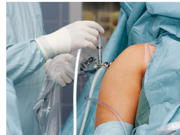
Zum breiten Spektrum der Orthopädie gehören Operationen an der Schulter

Erkrankungen der Schulter sind ein Schwerpunkt der Orthopädie am Krankenhaus Kirn. Hier erfolgen alle operativen Verfahren zur Therapie der Verletzung und Degeneration der Rotatorenmanschette (sowohl arthroskopisch als auch offen) und rekonstruktive Eingriffe. Zu unserem Spektrum gehören auch bei großen Defekten die Versorgung einer Schulterergelenksarthrose und der Kalkschulter. Die Implantation von Schulter-Endoprothesen in bestimmten Fällen rundet das Spektrum ab.