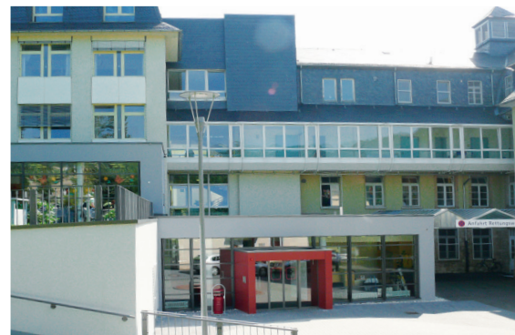
Das Diakonie Krankenhaus in Kirn