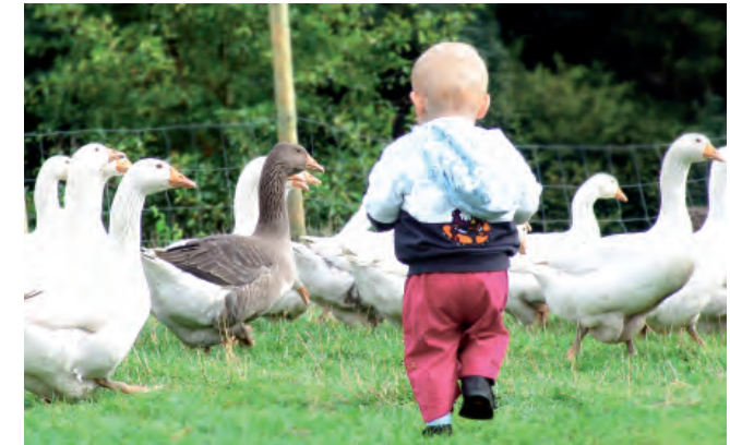
Auf der Gänseweide

Putenkeule, Putenschnitzel, Putenschinken, Putengrillwürste, Putenwurst (Dosen, verschiedene Sorten). Hähnchen, Hähnchenbrustfilet, Hähnchenschinken, Suppenhuhn, halbes oder ganzes Lamm, Lammkeule, Lammkotelette, Grillrippchen, tagesfrische Eier.