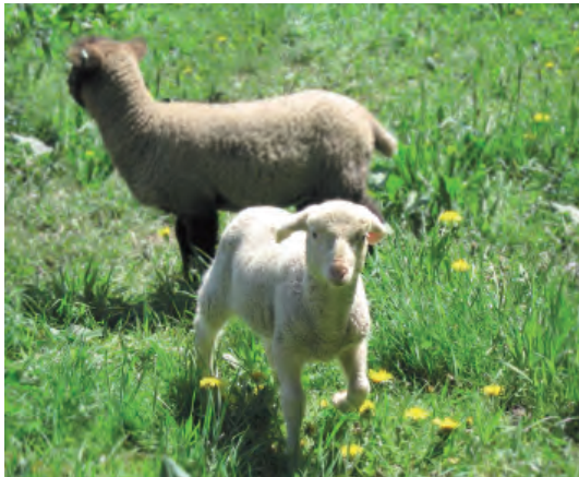
Junge Lämmer im Frühjahr

Die Beschäftigten betreuen liebevoll die überschaubaren Tierbestände.