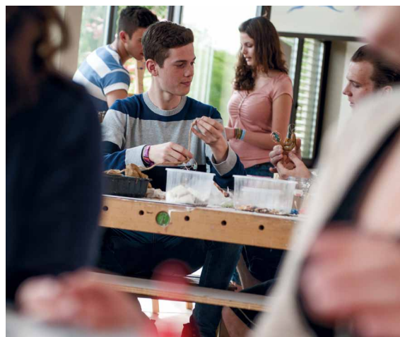
Kreativ-Projekte planen und durchführen