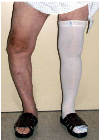
Vor und nach Op