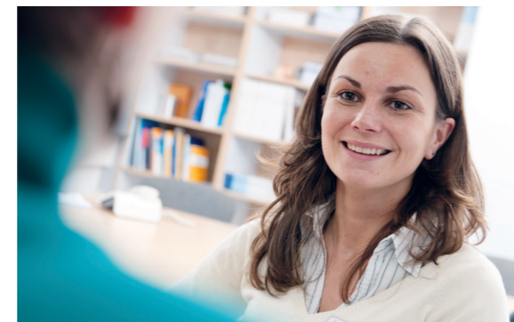
Ein Team ausgebildeter Fachärzte und Psychologen steht Ihnen zur Seite