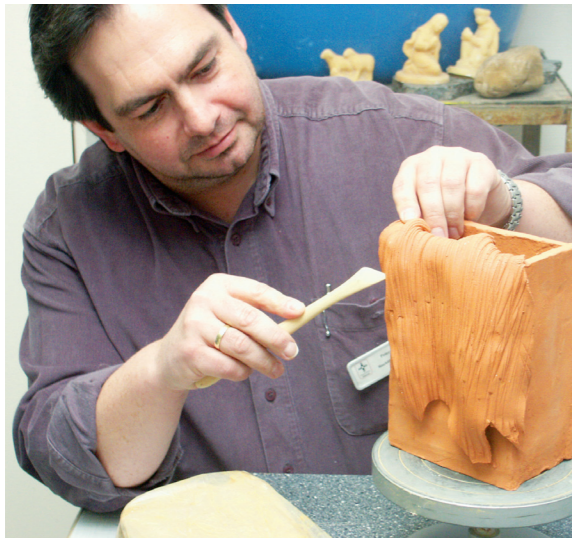
Individuelle Förderung in der Kunsttherapie

Eine niederschwellige Aufnahmemöglichkeit ist uns als Akutkrankenhaus eine äußerst wichtige Eigenschaft.