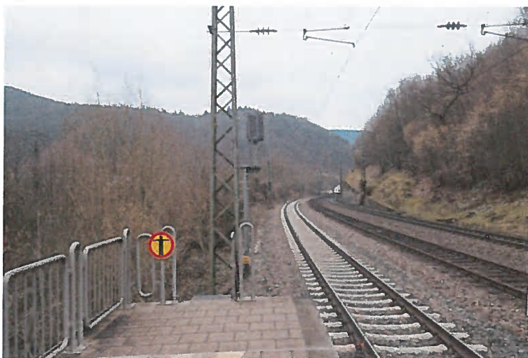
Abb. 1: Blick entlang der Trasse vom Ende des Bahnsteiges in Richtung Südosten

Das Bauvorhaben befindet sich im Zentrum von Weidenthal (Pfalz) unmittelbar nördlich des Bahnhofs links der DB-Strecke 3280 von Homburg (Saar) Hbf. nach Ludwigshafen (Rhein) Hbf. zwischen km 62,143 und 62,558. Weidenthal liegt in Rheinland-Pfalz, im Südwesten des Landkreises Bad Dürkheim in der Verbandsgemeinde Lambrecht.