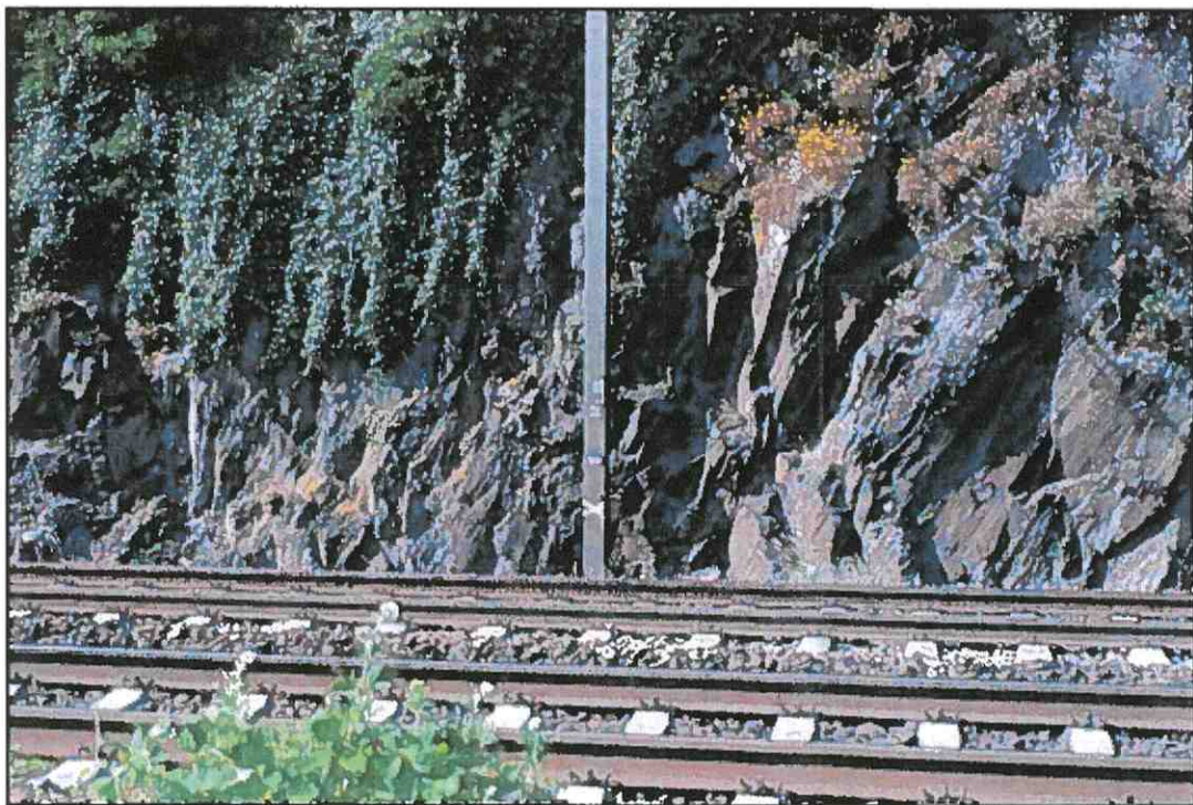
Detailfoto aus Abschnitt E, gleisnahe Felsböschung , ausbrechende Steine fallen direkt ins Gleis