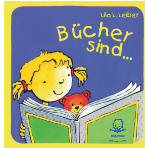
Ein erstes Bilderbuch zum Zeigen und Vorlesen

wurde für Eltern von neugeborenen Kindern entwickelt und enthält folgende Materialien zur Förderung der Sprache und des Lesens von klein auf: