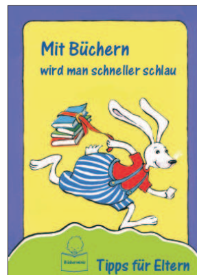
Eine Elternbroschüre mit Tipps zum Vorlesen und zur frühkindlichen Sprachförderung sowie einem Gutschein für einen kostenlosen Bibliotheksausweis (Text: mehrsprachig)