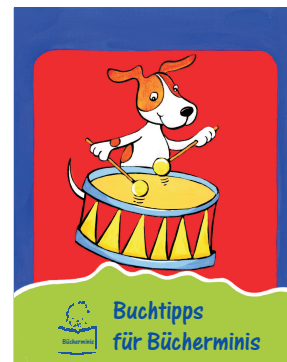
Ein Faltblatt mit Buchtipps für Bücherminis