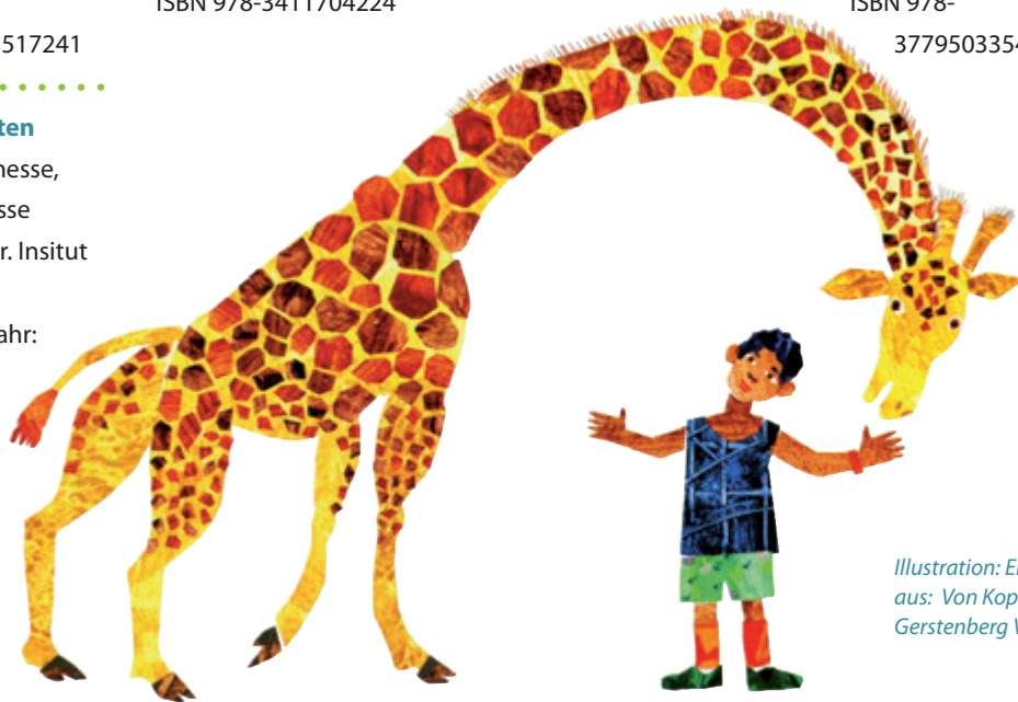
Illustration: Eric Carle aus: Von Kopf bis Fuß, Gerstenberg Verlag

Emma Damon, Katharina Ebinger Verlag: Gabriel Erscheinungsjahr: 2004 Preis: 7,78 € ISBN 978-3522300629