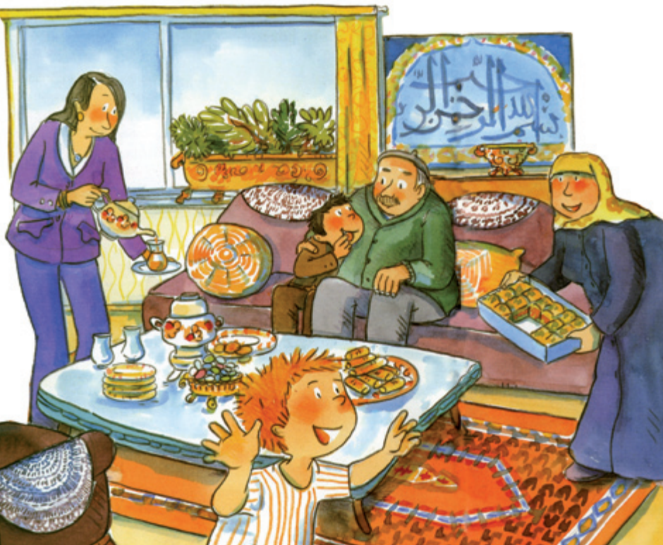
Illustration: Dorothea Tust, aus: Levent und das Zuckerfest, Carlsen Verlag

Arzu Gürz Abay Verlag: Talisa Erscheinungsjahr: 2011 Preis: 13,95 € ISBN 978-3939619185