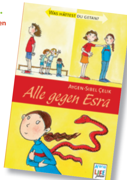
Illustration: Aygen-Sibel Çelik aus: Alle gegen Esra , Arena Verlag

Barack Obama Carl Hanser Verlag GmbH Erscheinungsjahr: 2011 Preis: 14,90 € ISBN 978-3446238060