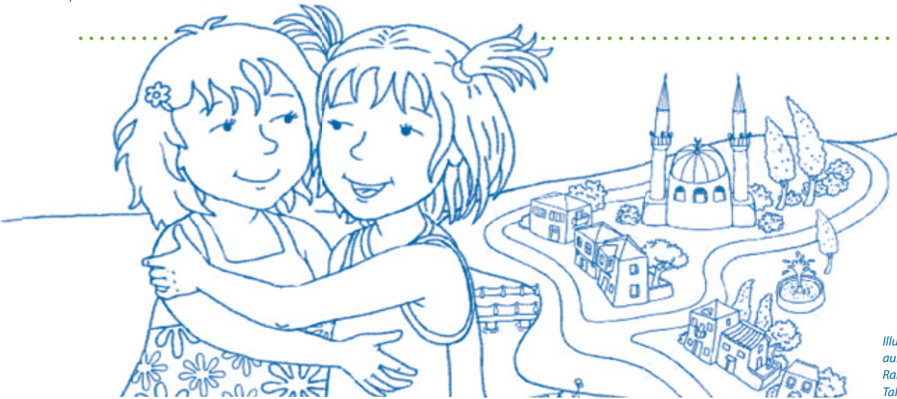
Illustration: Sibel Demirtaş aus: Leyla und Linda feiern Ramadan – Unterrichtsmaterial, Talisa Verlag

Es ist dann Aufgabe der Eltern und pädagogischen Fachkräfte, hier bewusst gegen zu steuern und die Kinder zu stärken.