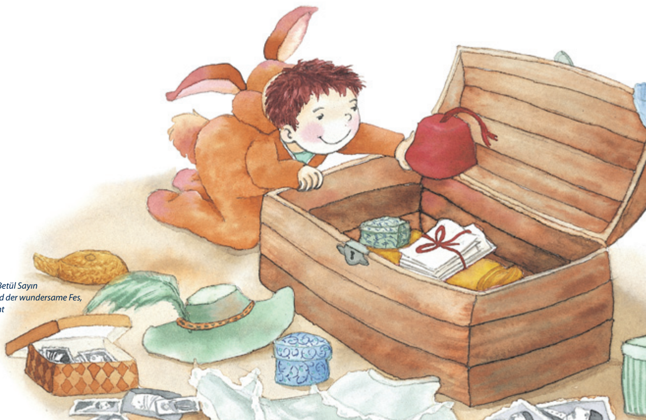
Illustration: Betül Sayın aus: Mert und der wundersame Fes , Edition Orient