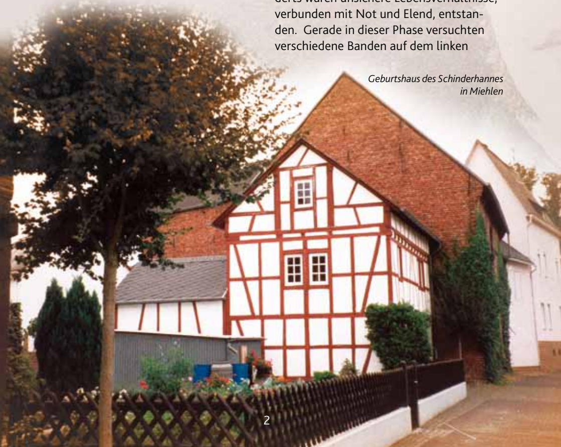
Geburtshaus des Schinderhannes in Miehlen

Die Kumpane und Helfershelfer des Schinderhannes entstammten einfachen, armen Milieus und standen am Rande der etablierten Gesellschaft. Sie waren Tagelöhner, fahrende Händler, Handwerker, entlassene Soldaten, Nichtsesshafte oder Bettler. Durch die politischen und sozialen Umwälzungen am Ende des 18. Jahrhunderts waren unsichere Lebensverhältnisse, verbunden mit Not und Elend, entstanden. Gerade in dieser Phase versuchten verschiedene Banden auf dem linken