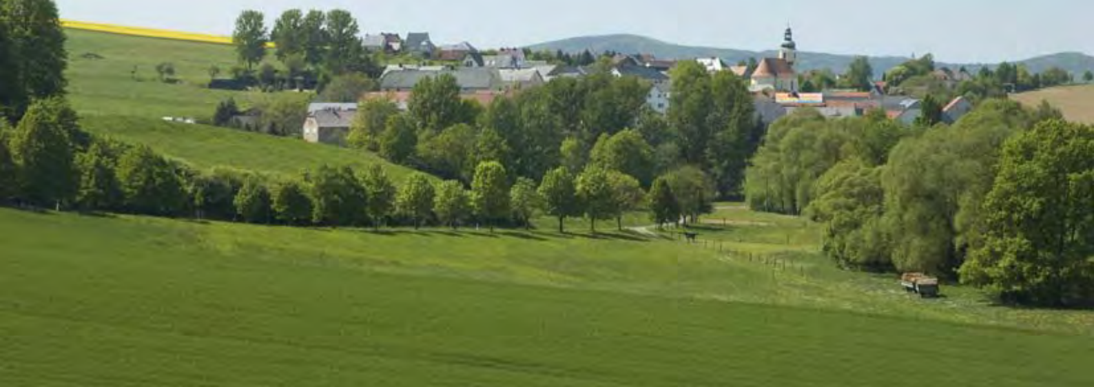
Landschaft im Osten Deutschlands

Stattdessen ziehen sie einen „starken Staat“ vor, der die wirtschaftliche Entwicklung lenkt. Der Nationalsozialismus war von je her auf eine nationale Planwirtschaft ausgerichtet, die sich bis zum Zweiten Weltkrieg (1939–1945) zu einer Kriegswirtschaft entwickelte. 32