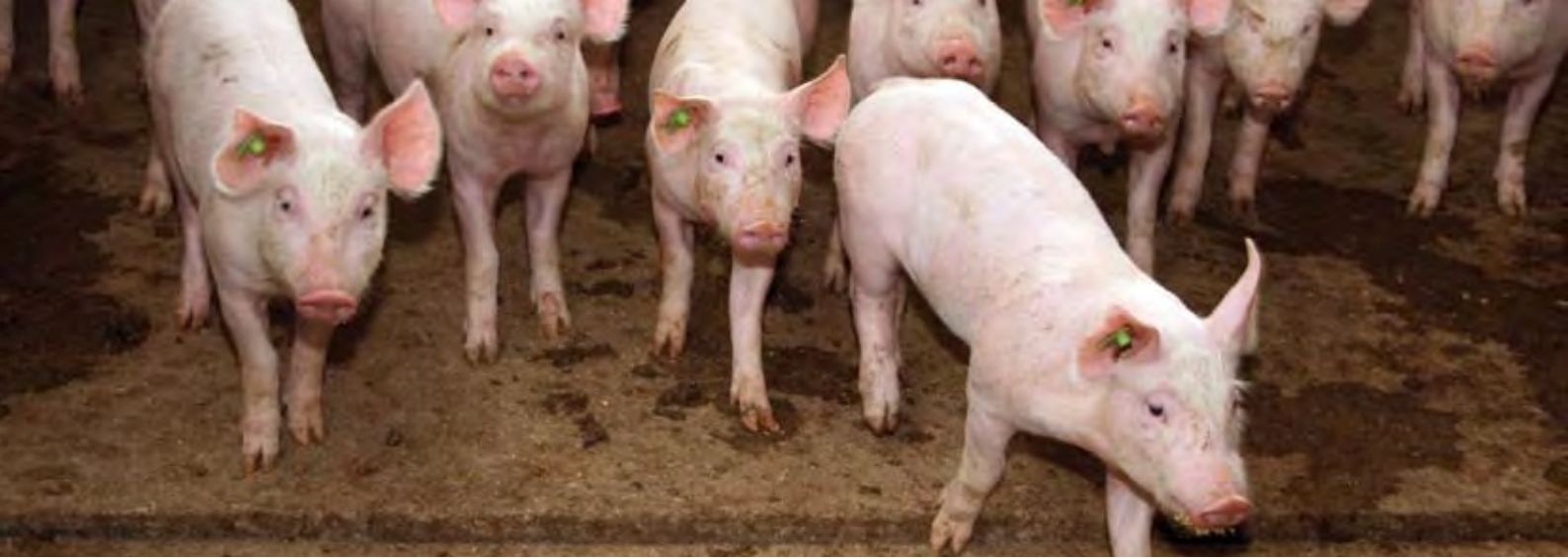
Schweinezuchtbetrieb in Thüringen

setzt und losgelöst von den tatsächlichen Lebensverhältnissen als Ideal verklärt. 46 Spätestens dann, wenn die Gesundung von Mensch, Gesellschaft und Landschaft in diesem Ideal zusammengeführt werden, ist diese Auffassung kritisch zu hinterfragen.