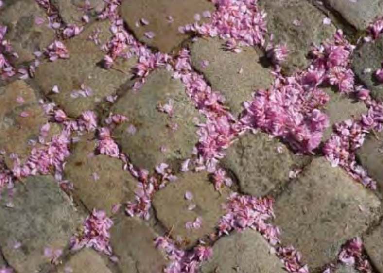
Kirschblüten in Berlin