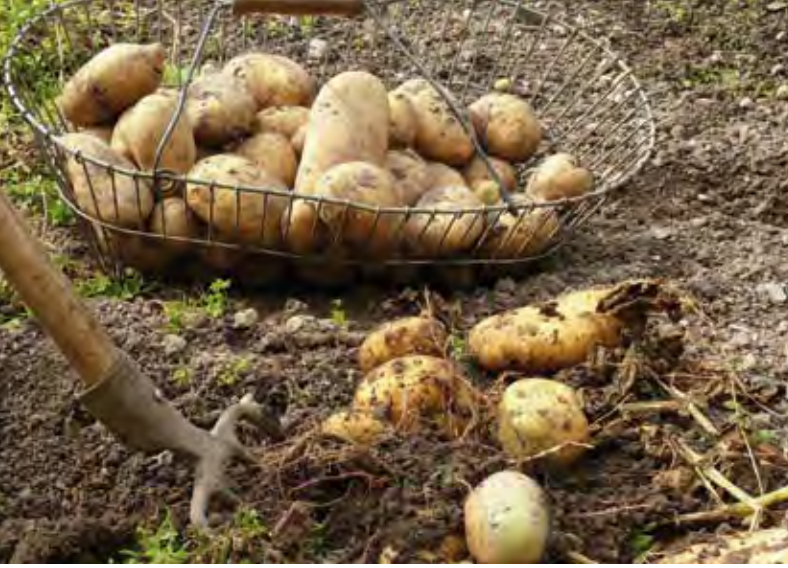
Kartoffeln, ursprünglich aus Südamerika