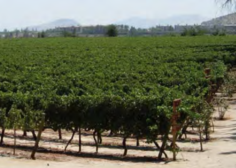
Weinbau in Chile