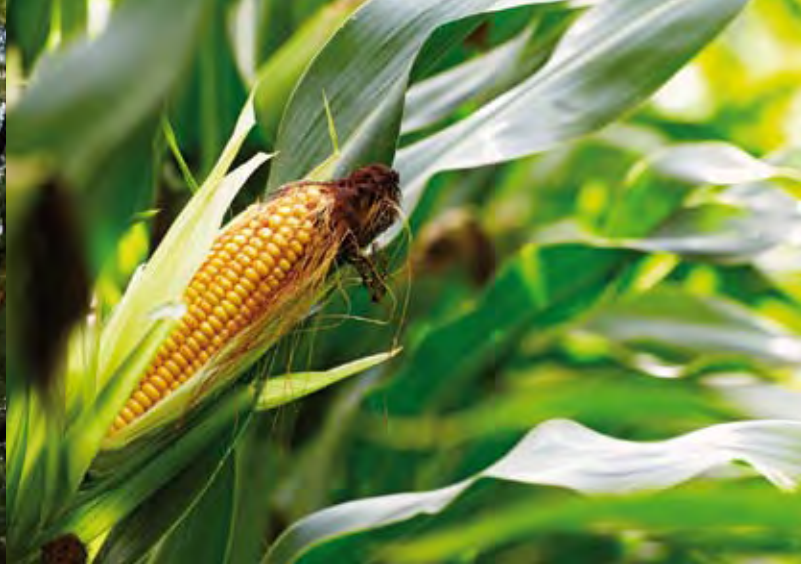
Mais, ursprünglich aus Mexiko