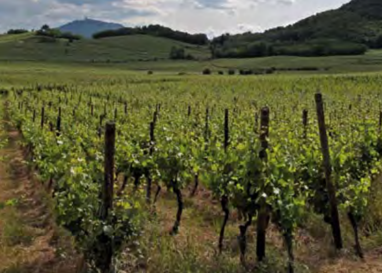
Weinbau in Frankreich