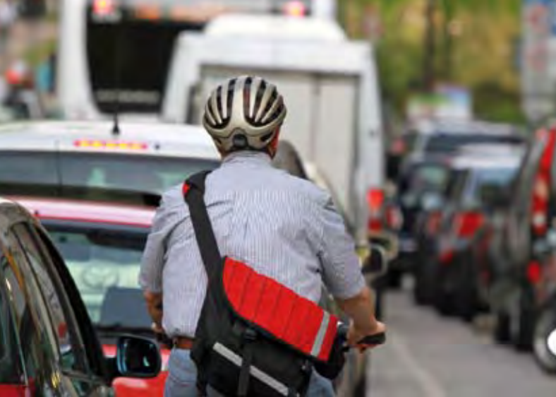
Rush-Hour in der Großstadt