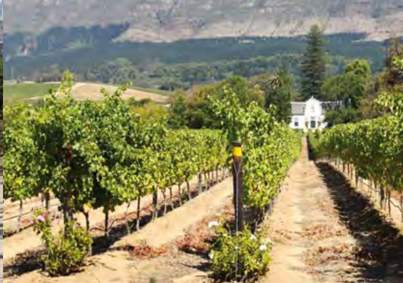
Weinbau in Südafrika