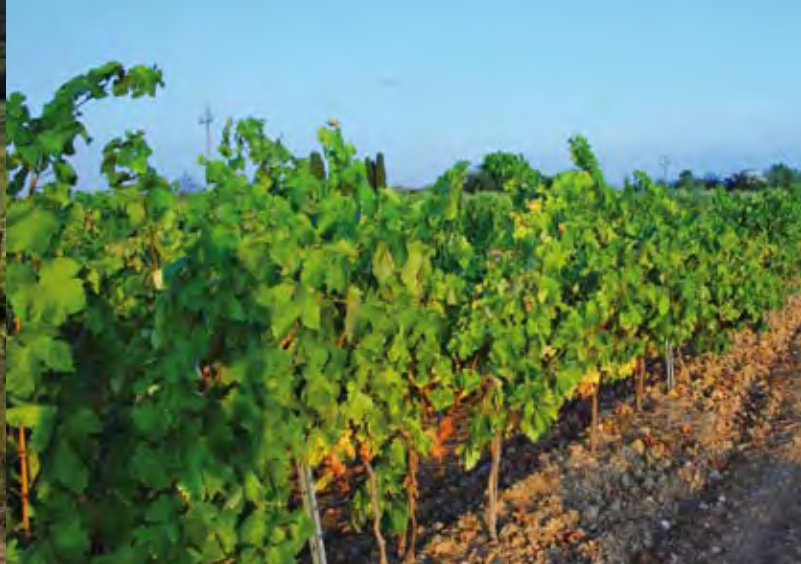
Weinbau in Spanien