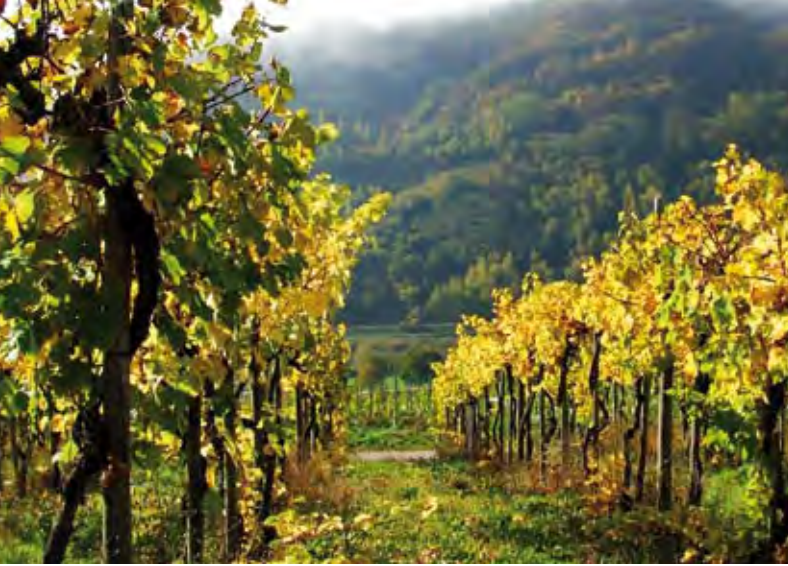
Weinbau in Deutschland