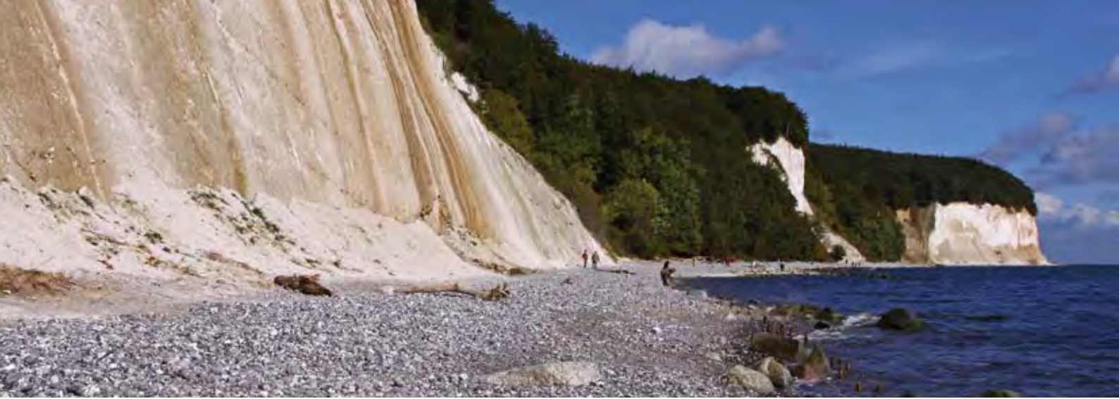
Kreidefelsen auf Rügen