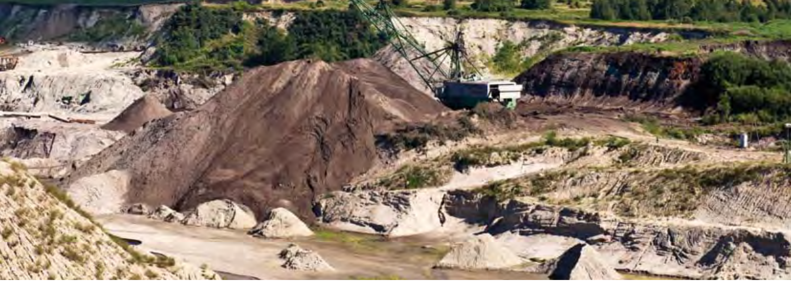
Tagebau in Russland