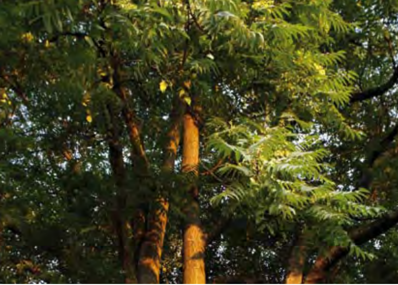
Götterbaum, ursprünglich aus China und dem nördlichen Vietnam