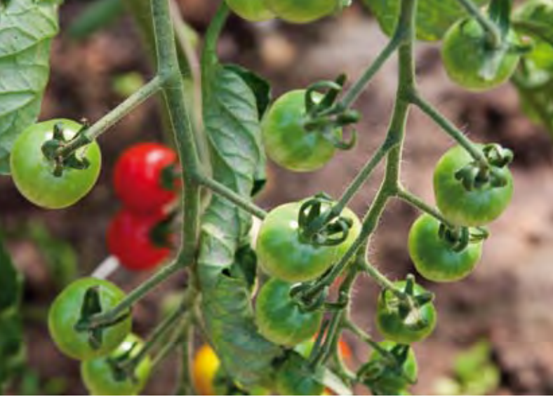
Tomatenpflanze, ursprünglich aus Mittel- und Südamerika