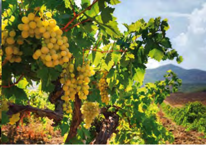
Weinbau in Italien

Geht man von diesem deutlich klareren Verständnis von Kulturlandschaft aus, so ist es folgerichtig, dass auch andere Gesellschaften ihre Landschaft prägen. Auch sie verfügen über eine Kulturlandschaft. Nicht nur deutsche, sondern auch russische, französische, US-amerikanische Landschaften sind selbstverständlich Kulturlandschaften.