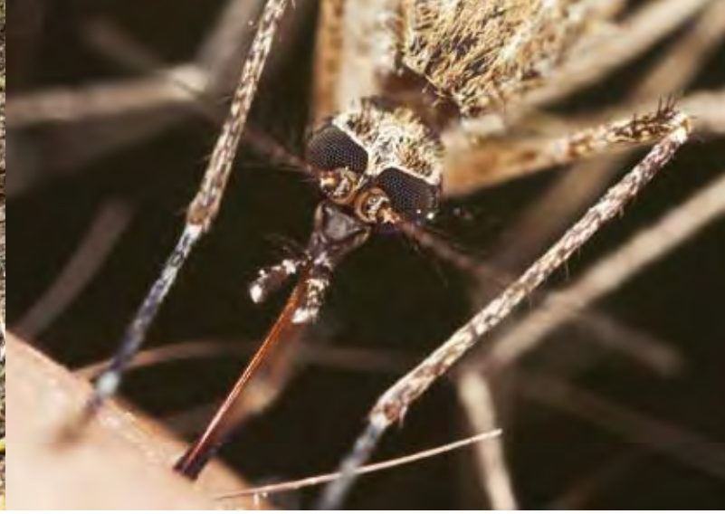
Malaria- oder Anophelesmücke, mittlerweile auf allen Kontinenten zuhause

Rechtsextreme nehmen Naturschutzargumente, die auf die Erhaltung der heimatischen Tier- und Pflanzenwelt, der Landschaft und Heimat zielen, aus diesen Gründen auf. Naturschutzakteurinnen und -akteure befinden sich nun plötzlich ungewollt in Übereinstimmung mit Programmpunkten rechtsextremer Parteien. Die unwissenschaftliche Auseinandersetzung mit der Neophyten-Thematik birgt die Gefahr in sich, bewusst oder unbewusst fremdenfeindliche Denkmuster wiederzuspiegeln und Naturschutzargumente selbst in den Sog entsprechender biologistischer Einstellungen zu bringen.