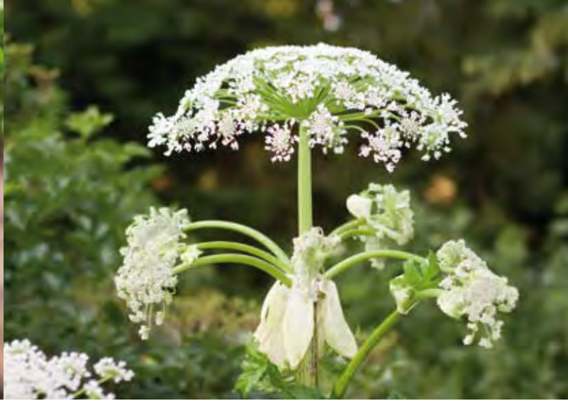
Riesenbärenklau, ursprünglich aus dem Kaukasus

land mindestens auf dem vorgefundenen Niveau der Verbreitung und Ausprägung erhalten bleiben.