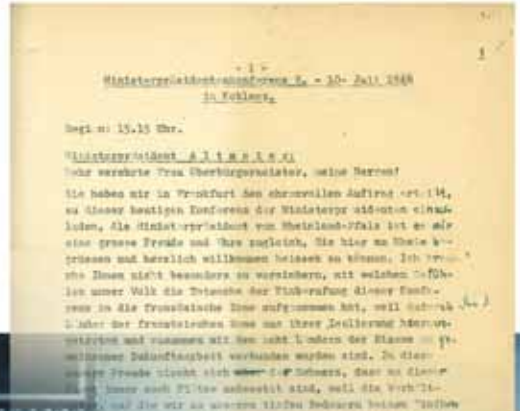
Die Teilnehmer der Konferenz bei der Eröffnungsansprache Peter Altmeiers; Seite des Redemanuskripts

Schnell war man sich einig, dass man den in den Frankfurter Dokumenten formulierten Maßnahmen nicht zustimmen könne. Einen Widerspruch sah man in der laut Dokument I für Deutschland vorgesehenen Verfassung und dem Besatzungsstatut aus Dokument III. Zudem bereitete die Abwesenheit der östlichen Länder Schwierigkeiten; sie konnten an dem Meinungsbildungsprozess nicht teilnehmen und mussten daher außen vor bleiben. Definitive Beschlüsse zu verabschieden wäre daher riskant gewesen, hätte dies doch den Riss, der zwischen den westlichen