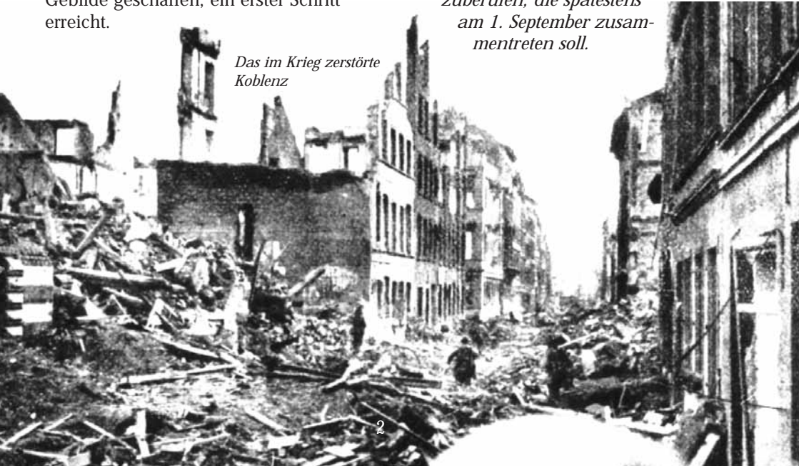
Das im Krieg zerstörte Koblenz

Die Militärgouverneure der drei westlichen Zonen überreichten den Ministerpräsidenten am 1. Juli 1948 in Frankfurt drei Dokumente, die als Frankfurter Dokumente in die Geschichte eingingen. Sie waren das Ergebnis einer im Frühjahr und Frühsommer in London tagenden Konferenz, an der neben den westlichen Besatzungsmächten USA, Großbritannien und Frankreich noch Belgien, die Niederlande und Luxemburg beteiligt gewesen waren. Die Dokumente enthielten Vorschläge zur Bildung einer westdeutschen verfassungsgebenden Versammlung, für eine mögliche Änderung der Ländergrenzen sowie für den Erlass des Besatzungsstatuts. In der politischen Sprache der damaligen Zeit hieß das: In Übereinstimmung mit den Beschlüssen ihrer Regierungen autorisieren die Militärgouverneure der amerikanischen, britischen und französischen Besatzungszone in Deutschland die Ministerpräsidenten der Länder ihrer Zonen, eine verfassungsgebende Versammlung einzuberufen, die spätestens am 1. September zusammentreten soll.