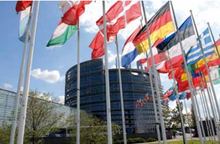
Zahlreiche Besuchergruppen besuchen die Plenarsitzungen des Europäischen Parlaments in Straßburg.

Abgeordneten – über europäische Gesetze abstimmt. Da hier tatsächliche Entscheidungen getroffen werden, ist das Medienaufkommen entsprechend groß.