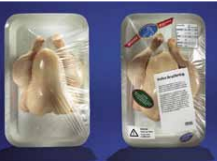
Die Kennzeichnung von Lebensmitteln ist ein wichtiges Anliegen des Europäischen Parlaments.

Jugend – etwa durch Austauschprogramme für Studierende und junge Arbeitnehmerinnen und Arbeitnehmer - ein wichtiges Anliegen.