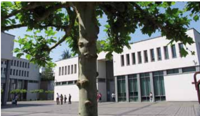
Die Europäische Rechtsakademie (ERA) wurde auf Initiative des Europäischen Parlaments 1992 in Trier gegründet und bietet Fortbildungen im Europarecht an.

Ein Problem für die Europaabgeordneten besteht darin, dass es keine festen Europawahlkreise gibt. Statistisch gesehen repräsentiert ein Abgeordneter bzw. eine Abgeordnete in Deutschland etwa 800.000 Menschen. Dies schafft in der Alltagsarbeit erhebliche praktische Probleme. Denn es ist auch für die wenigen rheinland-pfälzischen Europaabgeordneten kaum möglich, zu allen Bürgerinnen und Bürgern des Landes einen engen persönlichen Kontakt zu halten. Doch nutzen die Abgeordneten, beispielsweise durch Bürgersprechstunden die Möglichkeit, auf die Wünsche, Interessen, Bedürfnisse und Sorgen der Bürgerinnen und Bürger ihrer Herkunftsregion einzugehen.