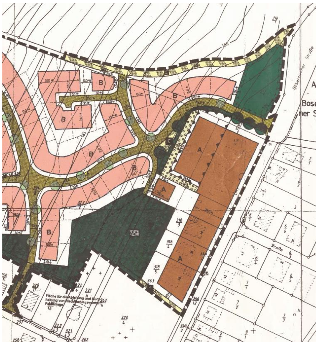
Abbildung 3: Auszug aus dem rechtskräftigen Bebauungsplan „In der Pruff, Am Kirchenland, Im langen Scheerbaum, In der Senftgewann“

Der Bebauungsplan setzt für den Geltungsbereich der gegenständlichen Änderung ein Dorfgebiet mit dem gemäß der BauNVO 1990 geltenden Nutzungsspektrum fest. Anlagen für sportliche Zwecke, Gartenbaubetriebe und Tankstellen sowie die Ausnahmen wurden dabei jedoch ausgeschlossen. Das Maß der baulichen Nutzung wurde mit GRZ 0,6 und GFZ 0,8 und maximal zwei Vollgeschossen in offener Bauweise festgesetzt. Die zulässige Überschreitung durch Nebenanlagen wurde auf 30% begrenzt. Die maximal zulässige Traufhöhe beträgt 6,20 m bei maximal zulässigen Dachneigungen zwischen 20° und 38°. Für eine Teilfläche des Geltungsbereiches wurden Schallschutzmaßnahmen gemäß § 9 Abs. 1 Nr. 24 BauGB (Planzeichen: Linie mit nach innen gerichteten Dreiecken) getroffen, die jedoch nicht mehr von Bedeutung ist, da sie die Stellung baulicher Anlagen landwirtschaftlicher Haupt- und Nebengebäude regelt.