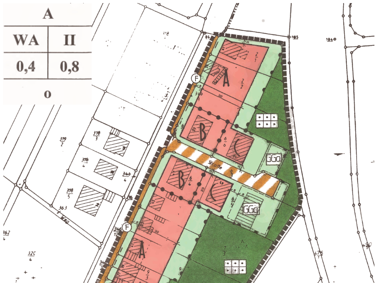
Abbildung 4: Auszug aus dem östlich angrenzenden Bebauungsplan „Ortsrand Ost“

Der östlich angrenzende Bebauungsplan „Ortsrand Ost“ setzt ein Allgemeines Wohngebiet, mit dem gemäß der BauNVO 1990 geltenden Nutzungsspektrum. Lediglich Tankstellen wurden aus- geschlossen. Das Maß der baulichen Nutzung wurde mit GRZ 0,4 und GFZ 0,8 und maximal zwei Vollgeschossen in offener Bauweise festgesetzt.