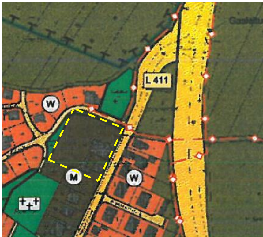
Abbildung 2: Auszug aus dem wirksamen Flächennutzungsplan

Im wirksamen Flächennutzungsplan wird der Geltungsbereich als gemischte Baufläche dargestellt. Im beschleunigten Verfahren ist gemäß § 13a Abs. 2 Nr. 2 BauGB der Flächennutzungsplan im Wege der Berichtigung anzupassen.