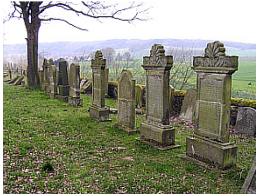
Auf dem jüdischen Friedhof in Wehrda 2007