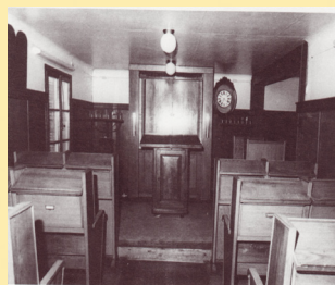
Intérieur de l'ancienne synagogue de Marckolsheim

Après la Seconde Guerre mondiale, les deux communautés se dispersèrent. Le départ des dernières familles de Mackenheim a eu lieu en 1982-1983. Il ne reste actuellement que deux familles israélites à Marckolsheim.