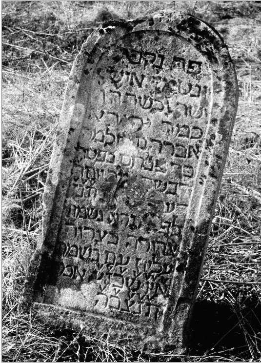
Grabstein des 1696 verstorbenen Salomon Geismar von Breisach