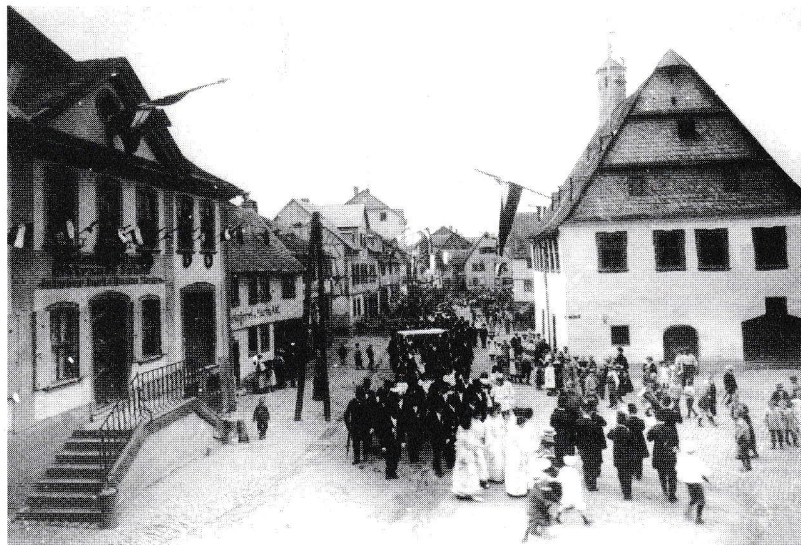
Festzug zur Einweihung der Synagoge 1904.

Zur Reichstagswahl am 6. November 1932 stimmten in Nastätten 661 von 999 Wählern für die NSDAP, bei der Reichstagswahl am 5. März 1933 waren es 820 von insgesamt 1161 Stim-