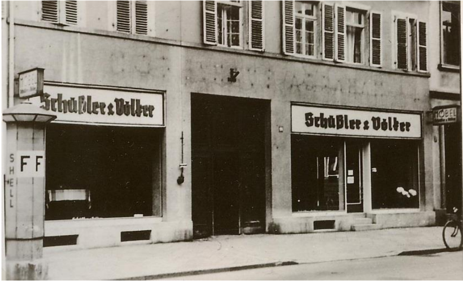
Abb. Das „arisierte“ Möbelhaus Schüßler & Völker, der alte Schriftzug Möbelhaus Abraham ist noch an der Fassade zu erkennen.