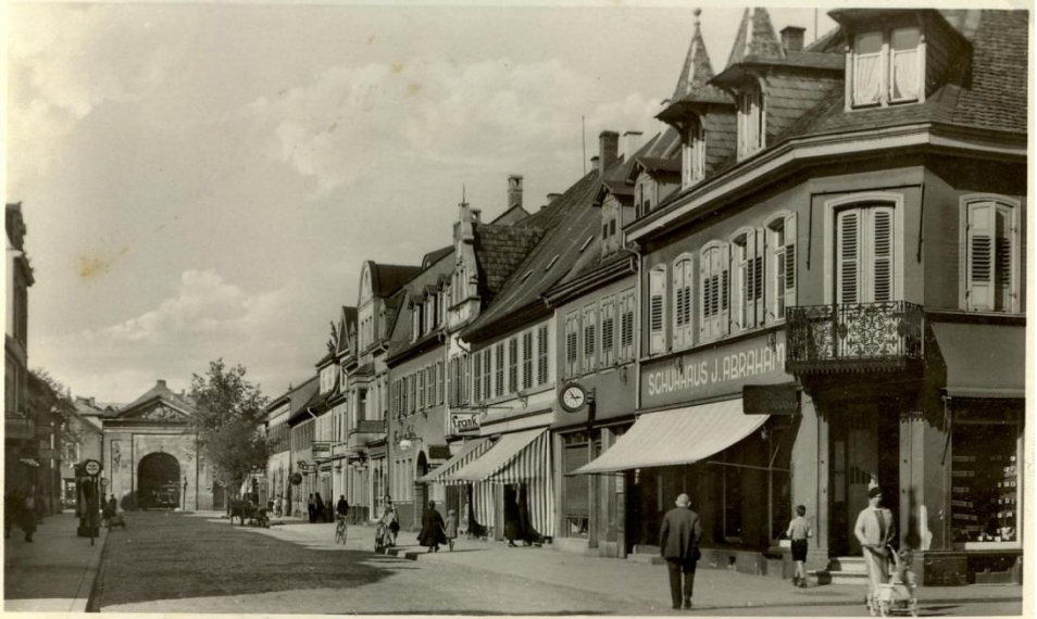
Frankenthal. Wormserstraße und Tor

Magazine.“ Zuletzt wohnte er in der Oggersheimer Straße 23 und starb am 14. Februar 1938 in Ludwigshafen. Nach seinem Tode flüchtete seine Witwe nach Palästina.