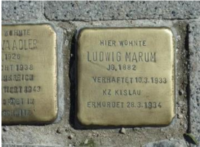
Abb. oben: Stolpersteine für Familie Adler und Abb. links: Stolperstein für Ludwig Marum