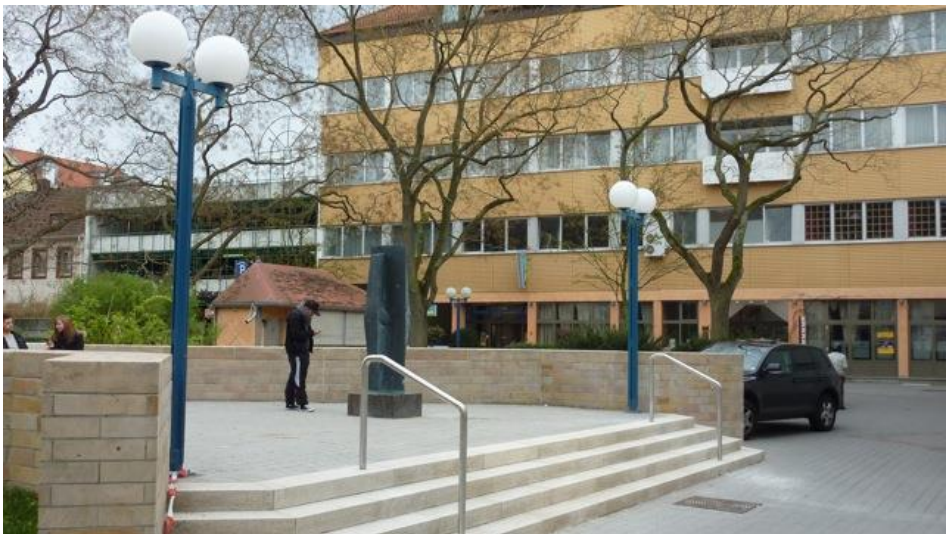
Abb: Standort der Stolpersteine an der Willy-Brandt-Anlage

Für die Familie Adler wurden am 12. April 2005 und für Ludwig Marum am 7. November 2006 Stolpersteine verlegt.