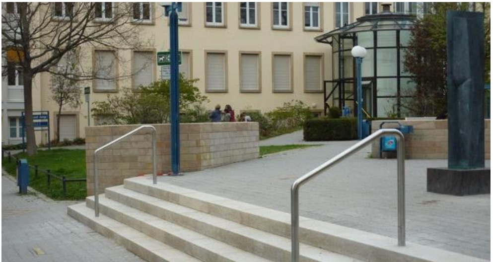
Abb. unten: Standort der Stolpersteine im Hintergrund das Frankenthaler Rathaus.