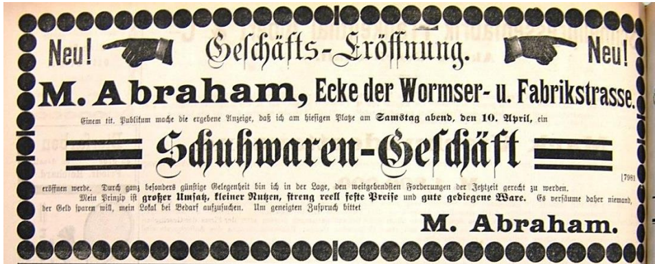
Abb. Anzeige vom 10. April 1897