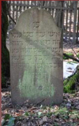
31 Maier Binsheim