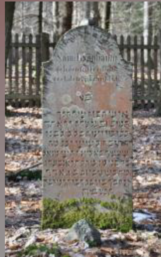
23 Samuel Grünbaum