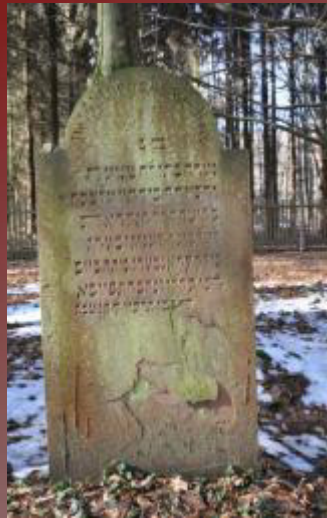
21 Delphine Königsberg