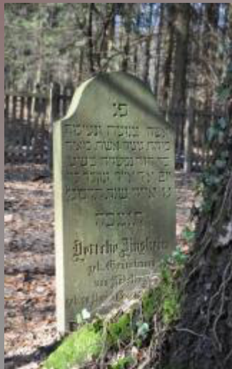
26 Jettche Binsheim