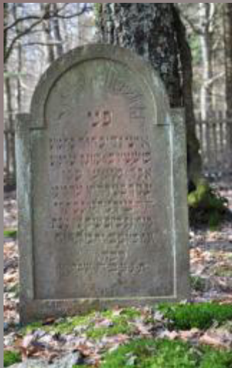
06 Salomon Herzfeld