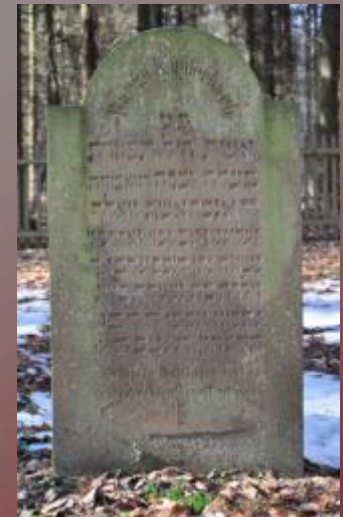
20 Range Kupferbach