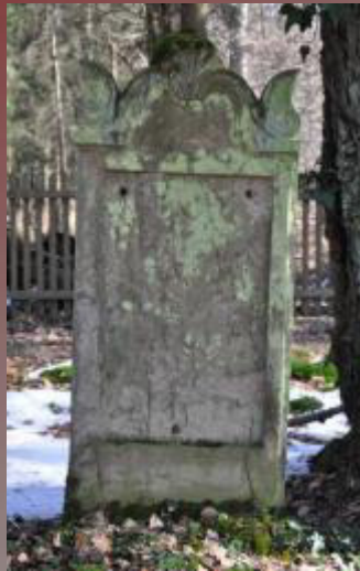
32 Amalie Strauss