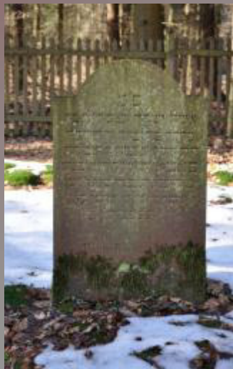
36 Fanny Königsberg