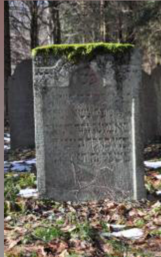
13 Note, Sohn des Hayyim Halevi Segal