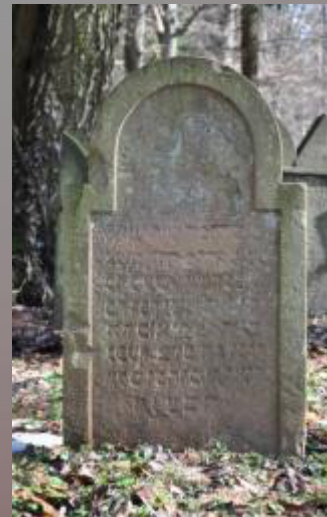
09 Meir, Sohn des Hayyim