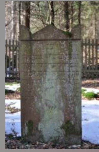
35 Settchen ...rich