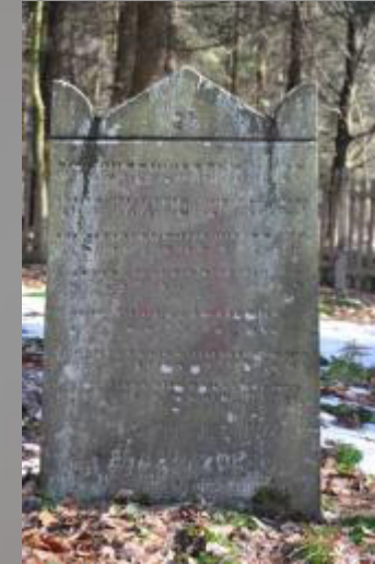
15 Moses Bär