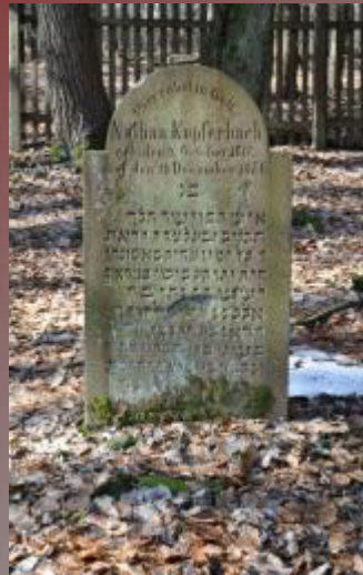
22 Nathan Kupferbach