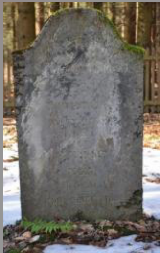
37 Aron Fleischhauer