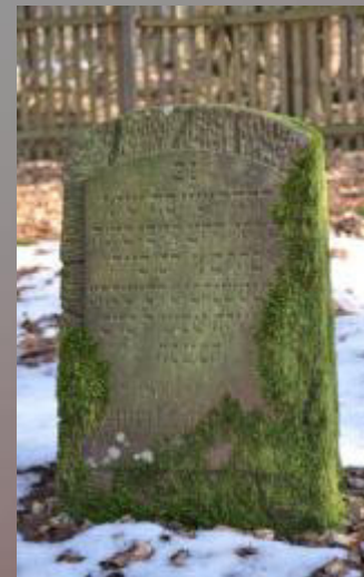
39 Heymann Strauss