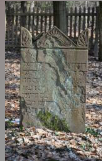
24 Tochter des Menahem