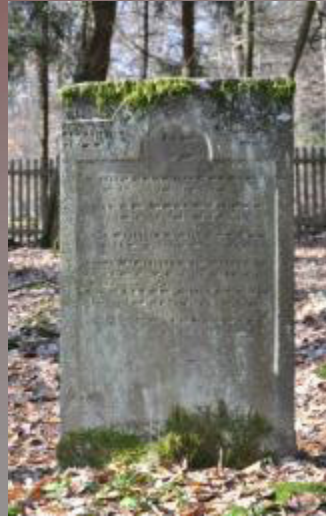
03 Zwi, Sohn des Issachar