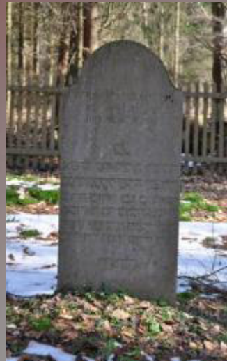
33 Bettchen Grünebaum