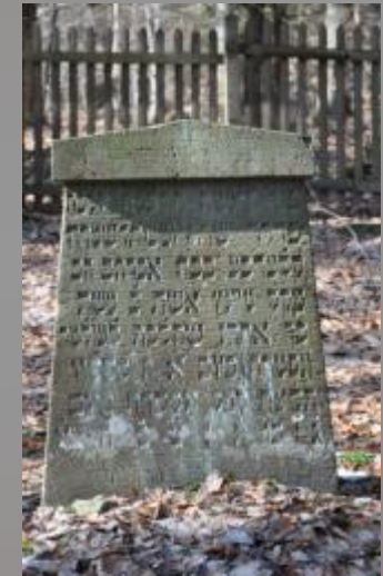
25 Klärche, Tochter des Abraham Hac