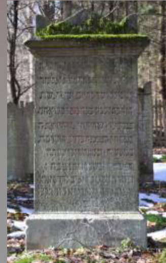
14 Sara Bär