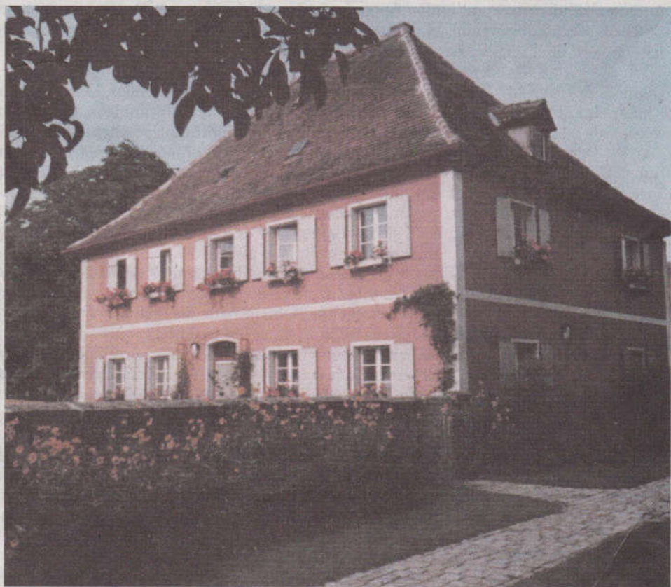
Binzwangen, Pfarrhaus, ca. 1970er Jahre