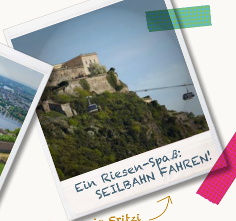
Ein Riesenspaß: SEILBAHN FAHREN!

Schwebe wie Fritzi und Willi zur Festung!