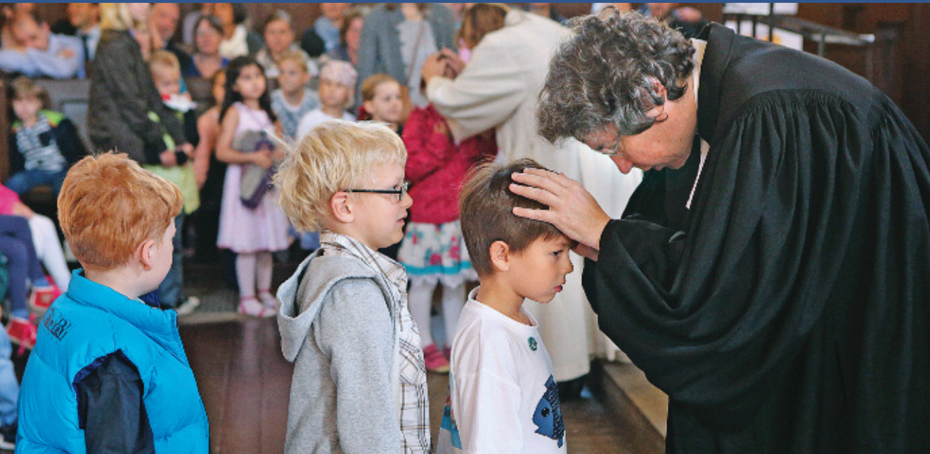
Ökumenischer Schulanfangs- gottesdienst

und Wertschätzung zum Ausdruck. Die Kirchen wirken in eine pluralistische und zunehmend säkular geprägte Gesellschaft hinein. Je mehr Einigkeit zwischen ihnen besteht, desto glaubwürdiger und überzeugender sind sie.