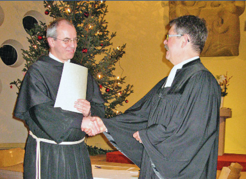
Abschluss einer Gemeindeparterschaft zwischen der protes- tantischen Paulus- kirchengemeinde und der katholischen Pfarrei Christ König in Kaiserslautern

in denen ein reges ökumenisches Leben herrscht, die eine Gemeindeparterschaft abgeschlossen haben oder die Mitglied einer lokalen ACK sind.