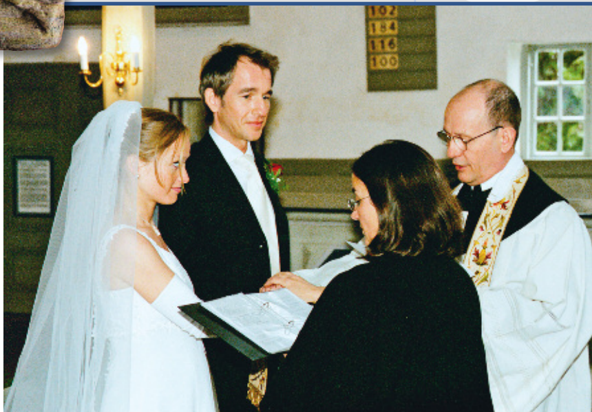
Gemeinsame Feier der kirchlichen Trauung

Familienorganisationen (AGF) und im Landesbeirat für Familienpolitik