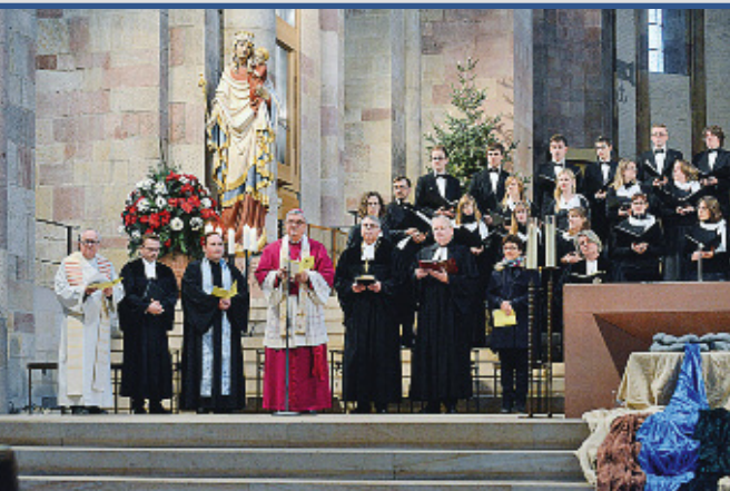
Ökumenischer Gottesdienst zur Gebets- woche für die Einheit im Dom

der Geschichte nicht zerstört worden ist. Zu diesem Kern gehören der Glaube an den einen Herrn und die Verbindung durch die eine Taufe. Umso mehr erfüllt es uns mit Schmerz, dass wir unseren Glauben in getrennten Kirchen bezeugen und nicht in einem gemeinsamen Abendmahl beziehungsweise in einer gemeinsamen Eucharistie feiern. Dieser Schmerz treibt uns an, auf dem Weg zur Einheit mit ganzem Herzen und ganzer Kraft voranzuschreiten.