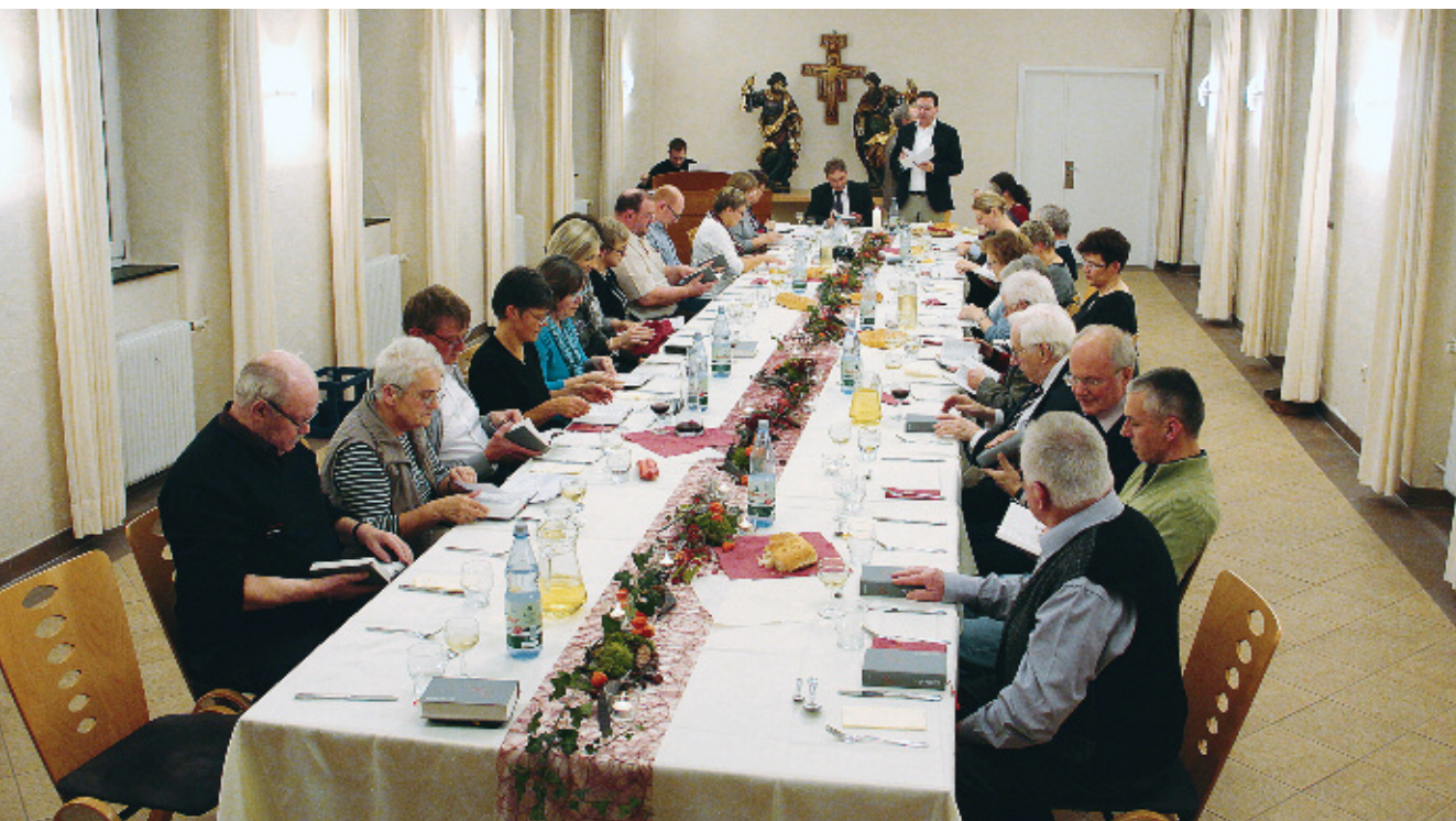
Begegnung von Pfarrgemeinderat und Presbyterium mit Agapefeier in Grünstadt

In einem ersten Teil „Ökumene in den neuen Strukturen“ (3.1) geht es um Formen der Begegnung, des Informationsaustauschs und der Zusammenarbeit vor Ort. Konkret geht es um gemeinsame Treffen der Gremien bzw. der haupt- und nebenamtlichen Seelsorgerinnen und Seelsorger, um die Benennung von Ansprechpersonen für ökumenische Belange sowie um die Bildung von Ökumene-