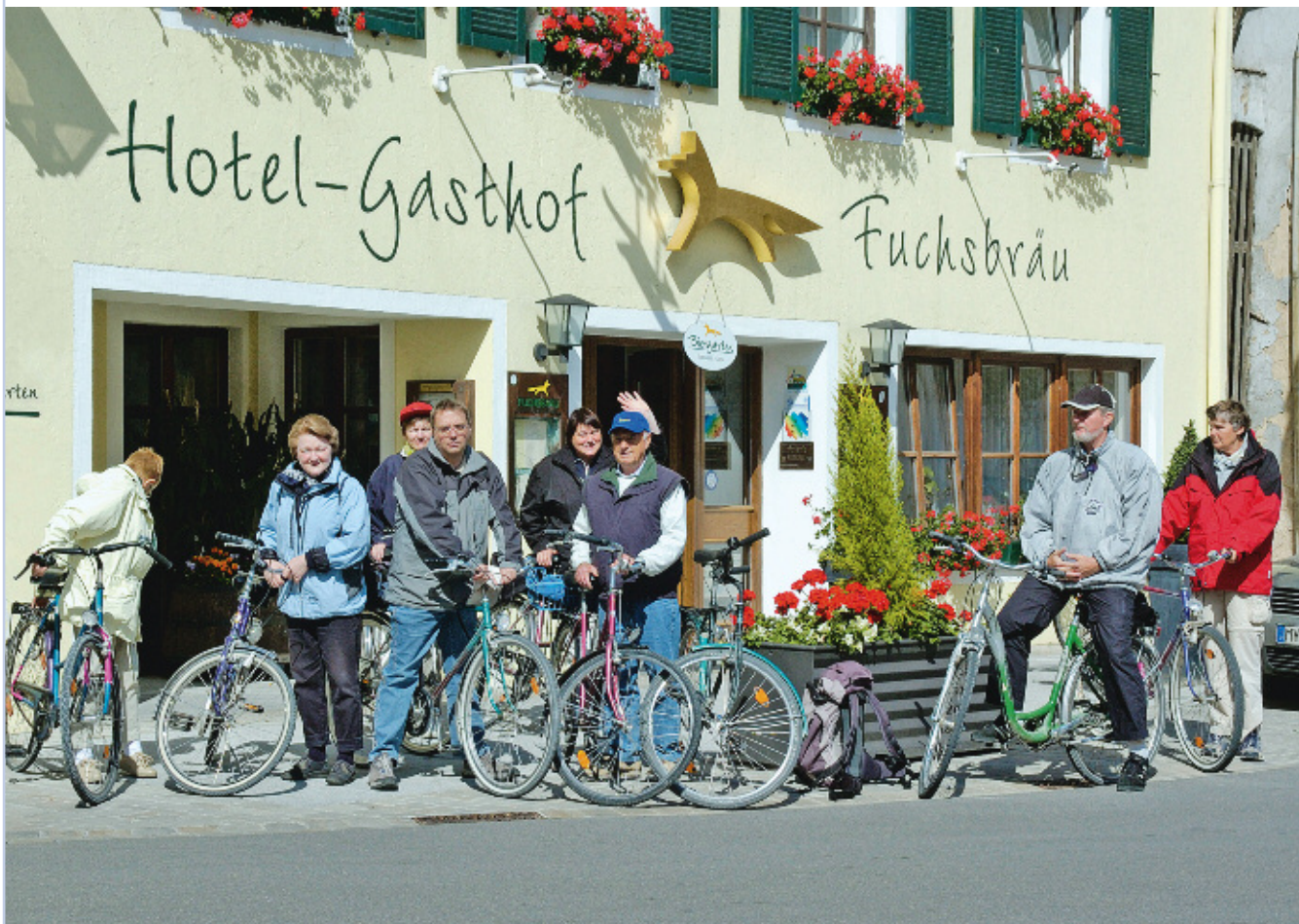
Aktive Senioren gemeinsam unterwegs