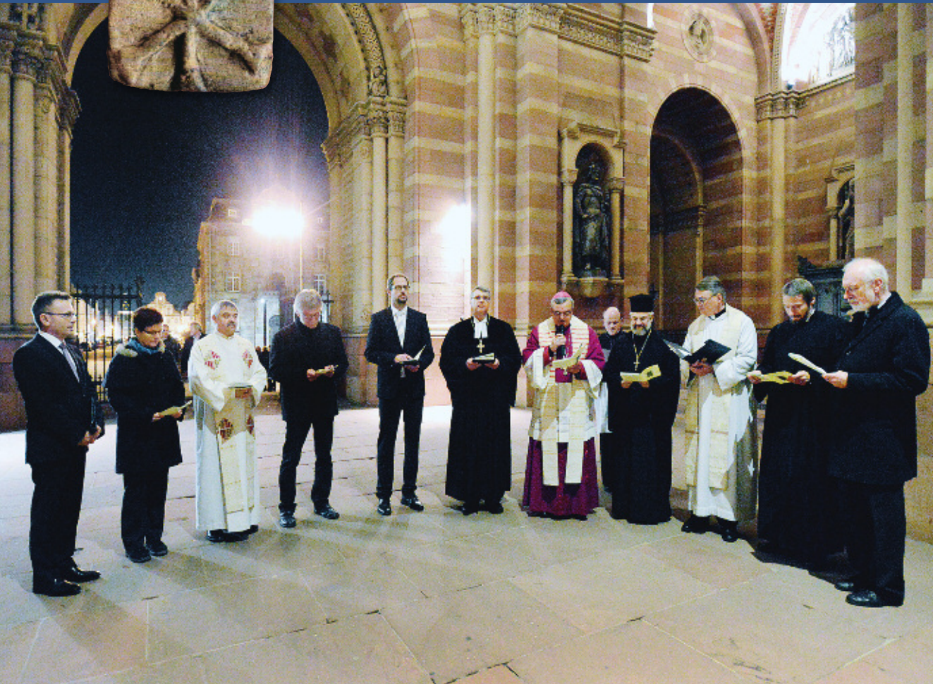
Gottesdienst zum 50. Jahrestag der Verabschiedung des Ökumenismusdekrets „Unitatis redintegratio“ des II. Vatikanischen Konzils im Dom zu Speyer

der Schöpfung, Ökumenisches Gebet im Advent