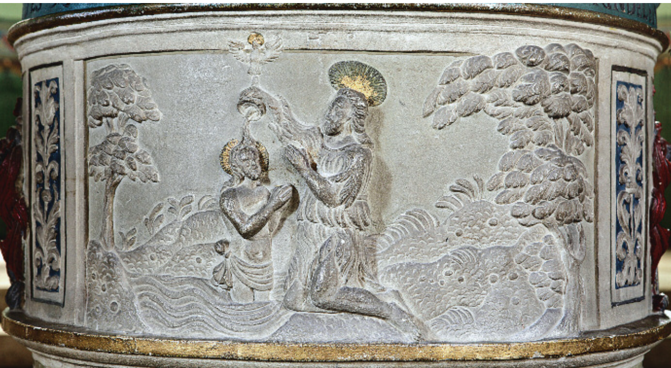
Die Taufe Jesu auf einem Taufstein

Für das Mühen um die sichtbare Einheit aller Christinnen und Christen wird seit dem 20. Jahrhundert der Ausdruck „Ökumene“ verwendet. Das Wort „Oikumene“ („ ἡ οἰκουμένη “, das Bewohnte) stammt aus dem Griechischen und meint den ganzen von Menschen bewohnten Erdkreis.