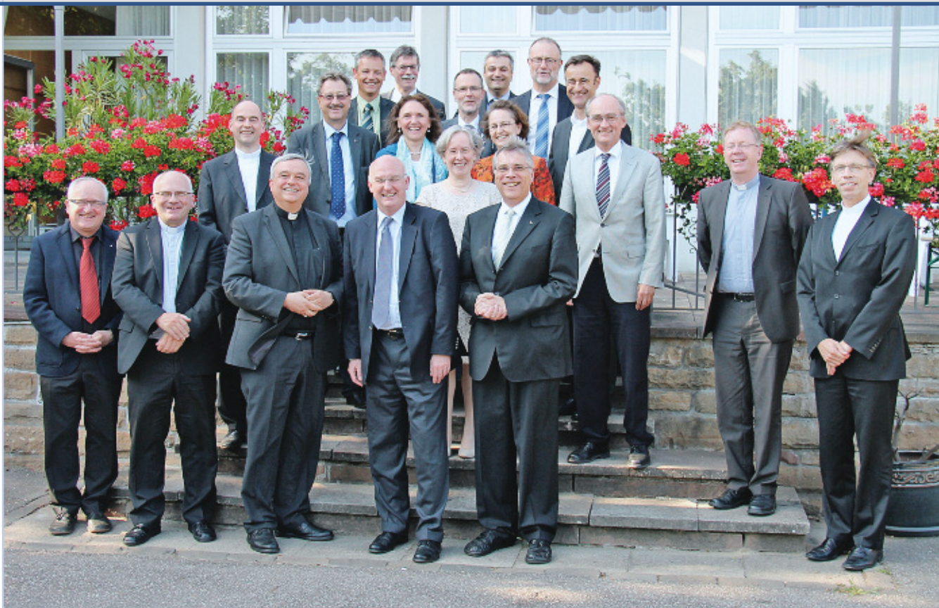
Begegnung der Leitungsgremien von Bistum und Landeskirche

weniger Interessierter angesehen. Vielmehr wissen sich die Kirchen als Ganze dem Anliegen der christlichen Einheit verpflichtet.