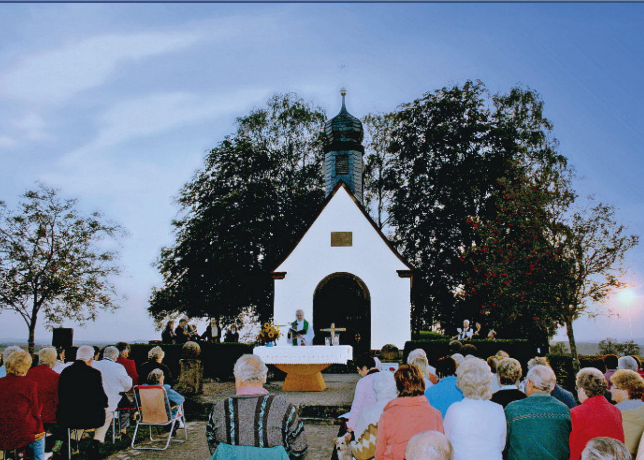
Ökumenischer Gottesdienst auf der Sickingen Höhe

deskirche sind in erster Linie die Seelsorger vor Ort. Im Rahmen der jährlichen Begegnung aller haupt- und nebenamtlichen Seelsorgerinnen und Seelsorger (siehe 3.1: Ökumene in den neuen Strukturen ) treffen sie eine Festlegung aller ökumenischen Gottesdienste für das kommende bzw. laufende Jahr. Im Rahmen dieser Planung ist zu überlegen, wann und in welcher Gemeinde/Kirchengemeinde ein ökumenischer Gottesdienst an einem Sonn- oder Feiertag gefeiert werden soll. Auf katholischer Seite wird darüber hinaus im Rahmen der Erstellung des Pastoralen Konzepts grundsätzlich geregelt, was an ökumenischen Gottesdiensten innerhalb der Pfarrei sinnvoll und vom Pastoralteam leistbar ist.