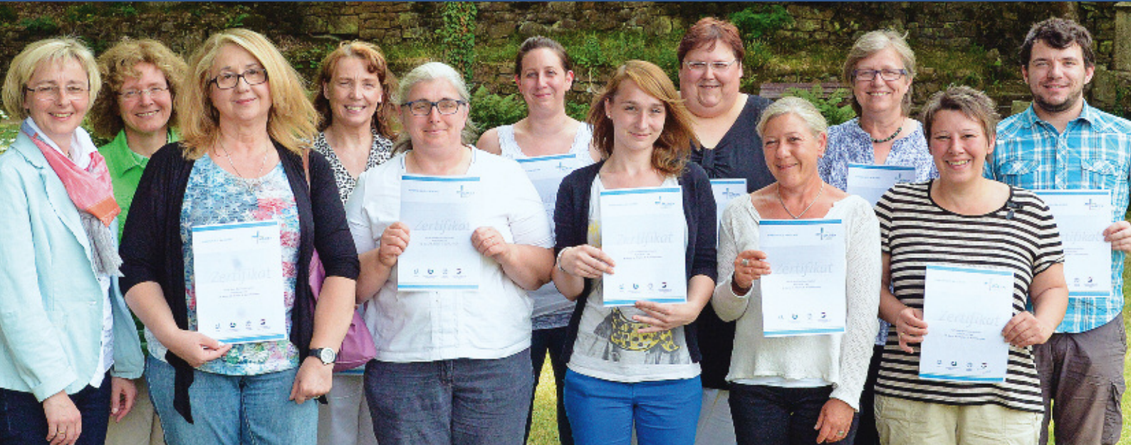
Absolventen des Hospizhelferkurses