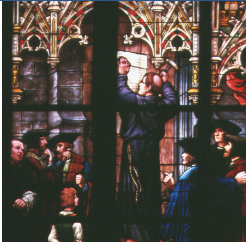
Thesenanschlag von Martin Luther – Glasfenster in der Gedächtniskirche der Protestation

Das gute ökumenische Miteinander ist alles andere als selbstverständlich angesichts der Rolle, welche die Pfalz, insbesondere die Stadt Speyer, in der Reformationgeschichte spielt: Im April 1529 protestieren auf dem Speyerer Reichstag sechs Fürsten und 14 Reichsstädte für die Freiheit in Glaubensfragen und gegen eine Zurückdrängung der Reformation in den evangelischen Städten und Ländern. Diese „Speyrer Protestation“ führt dazu, dass sich in Europa das Prinzip der Glaubens- und Religionsfreiheit allmählich durchsetzt. Die Konfessionalisierung schreitet weiter voran. Auch im Gebiet der heutigen Pfalz/Saarpfalz kommt es in der Folgezeit zu einer kirchlichen