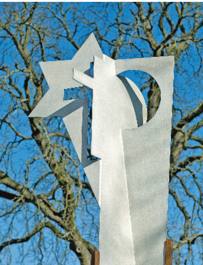
Skulptur ORIENT-OKZIDENT von Helga Lannoch in Waghäusel