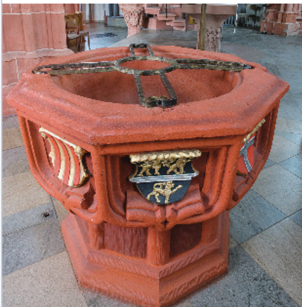
Taufstein der Schlosskirche in Bad Dürkheim

Es gibt einen Kern der Einheit, der trotz vieler großer und kleiner Kirchenspaltungen im Lauf