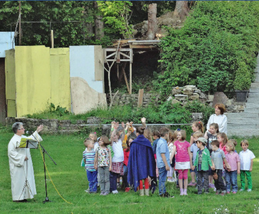
Abschlussgottesdienst des ökumenischen Kinderbibeltages auf der Naturbühne Gräfinthal