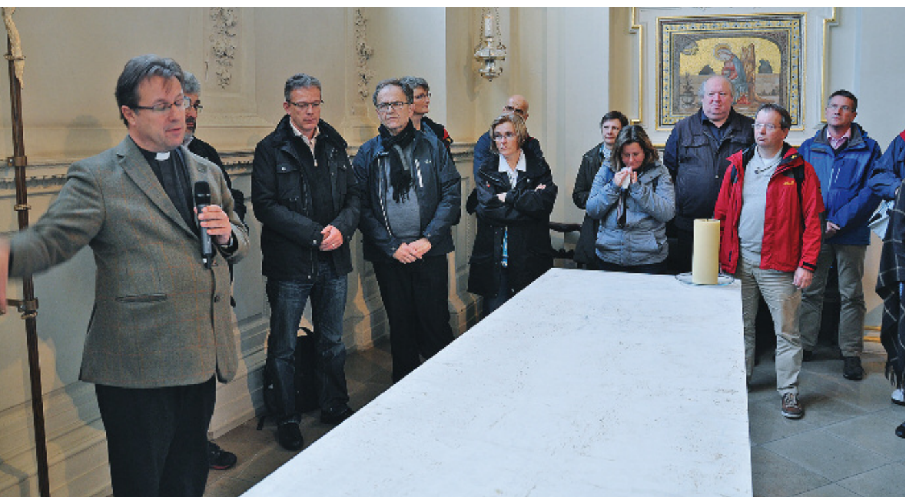
Ökumenisches Pfarrkolleg in London – Begegnung mit der anglikanischen Gemeinde St Martin in the fields

Die lange und lebendige ökumenische Tradition sowie die Vielfalt und Intensität des ökumenischen Miteinanders der Evangelischen