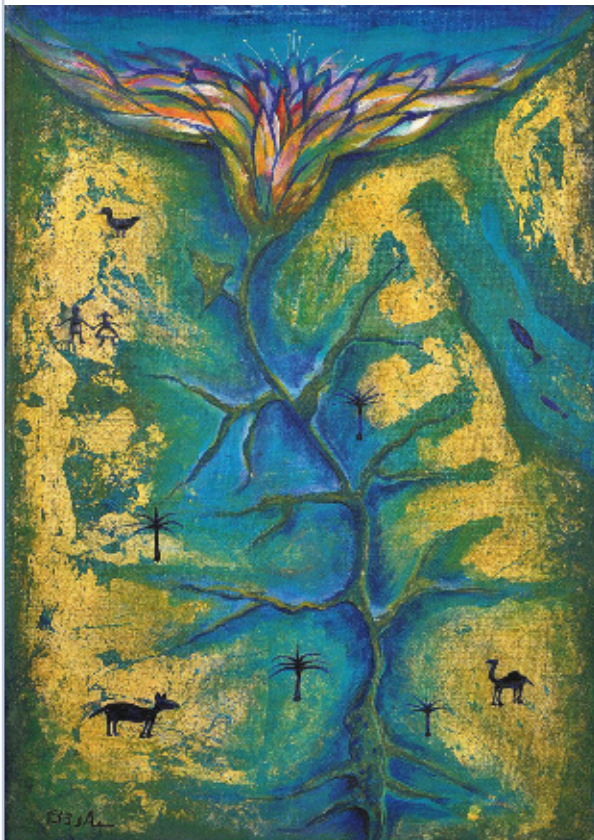
Weltgebetstag 2014: Wasserströme in der Wüste

Als Christinnen und Christen glauben wir an Gott, den „Schöpfer des Himmels und der Erde“, an Jesus Christus, der in seiner Menschwerdung zum Bruder aller geworden ist, und an den Heiligen Geist, der alles lebendig macht. Die Achtung vor dem Leben und dessen Bewahrung vor Zerstörung ist daher eine Grundhaltung und ein Gebot für alle Christinnen und Christen. Das schließt eine Bewahrung und Pflege der Lebensräume und eine nachhaltige Bewirtschaftung der natürlichen Güter ein. Leben und Schöpfung sind aber auch bedroht durch soziale Konflikte, die durch Ungerechtigkeit entstehen. Der Einsatz für Frieden und Gerechtigkeit ist daher untrennbar mit dem Einsatz für das Leben und die Bewahrung der Schöpfung verbunden. Deshalb haben sich die Kirchen ausdrücklich verpflichtet, ihre Verantwortung für den Schutz