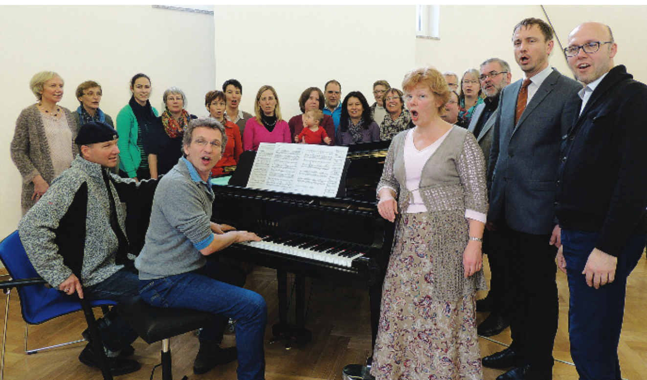
Gemeinsame Vorbereitung auf einen ökumenischen Kinderchortag