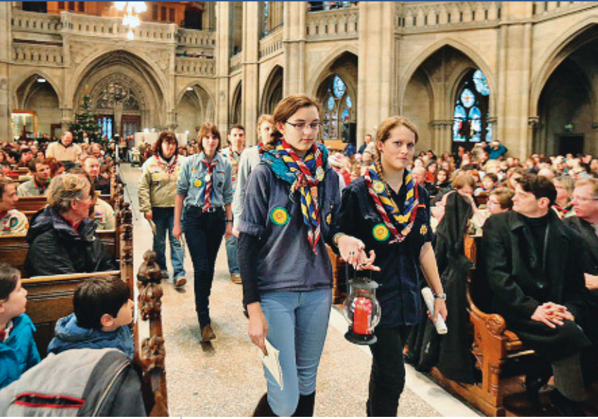
Ökumenischer Jugendgottesdienst zur Aussendung des Friedenslichts aus Betlehem in der Gedächtniskirche

ligiöser Praxis, zu theologischen Fragen und zu politischen Entwicklungen