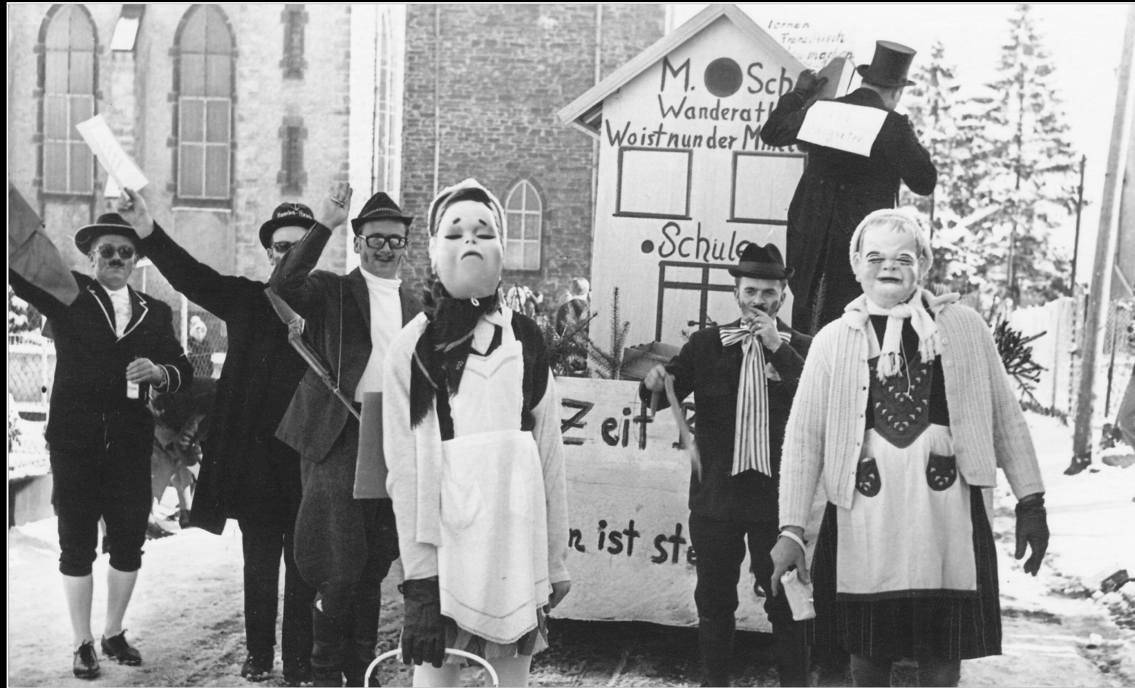
Karnevalsumzug in Langenfeld