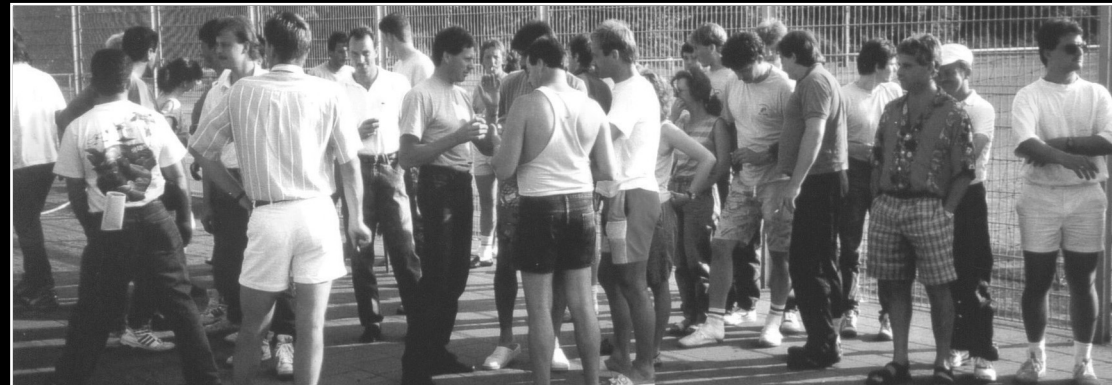
Auswärtsturniere der Thekenmannschaft Dynamo Oel in Düsseldorf – 1990