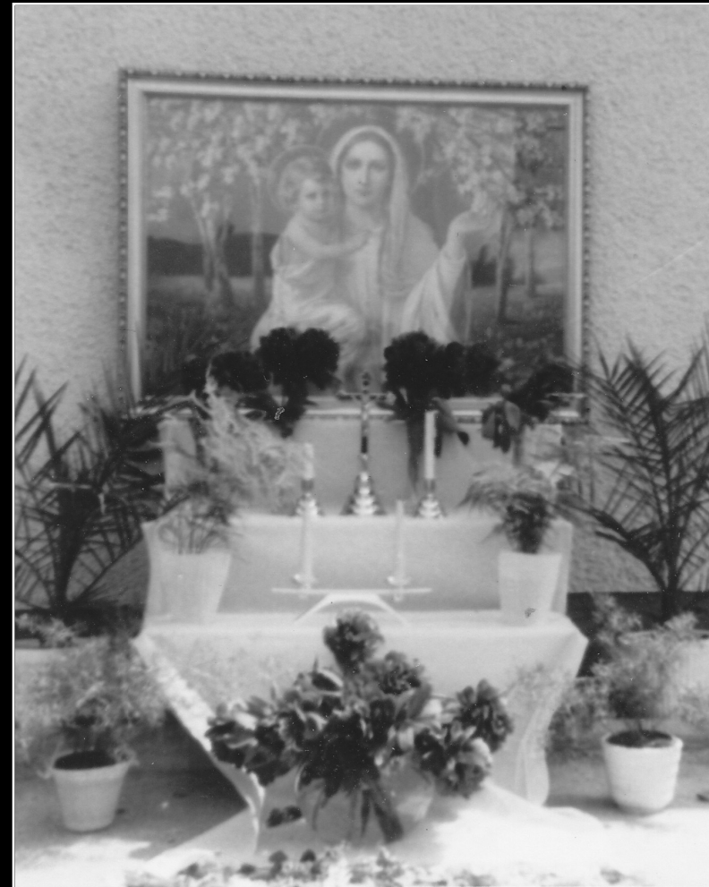
Fronleichnam – Altar – 1967