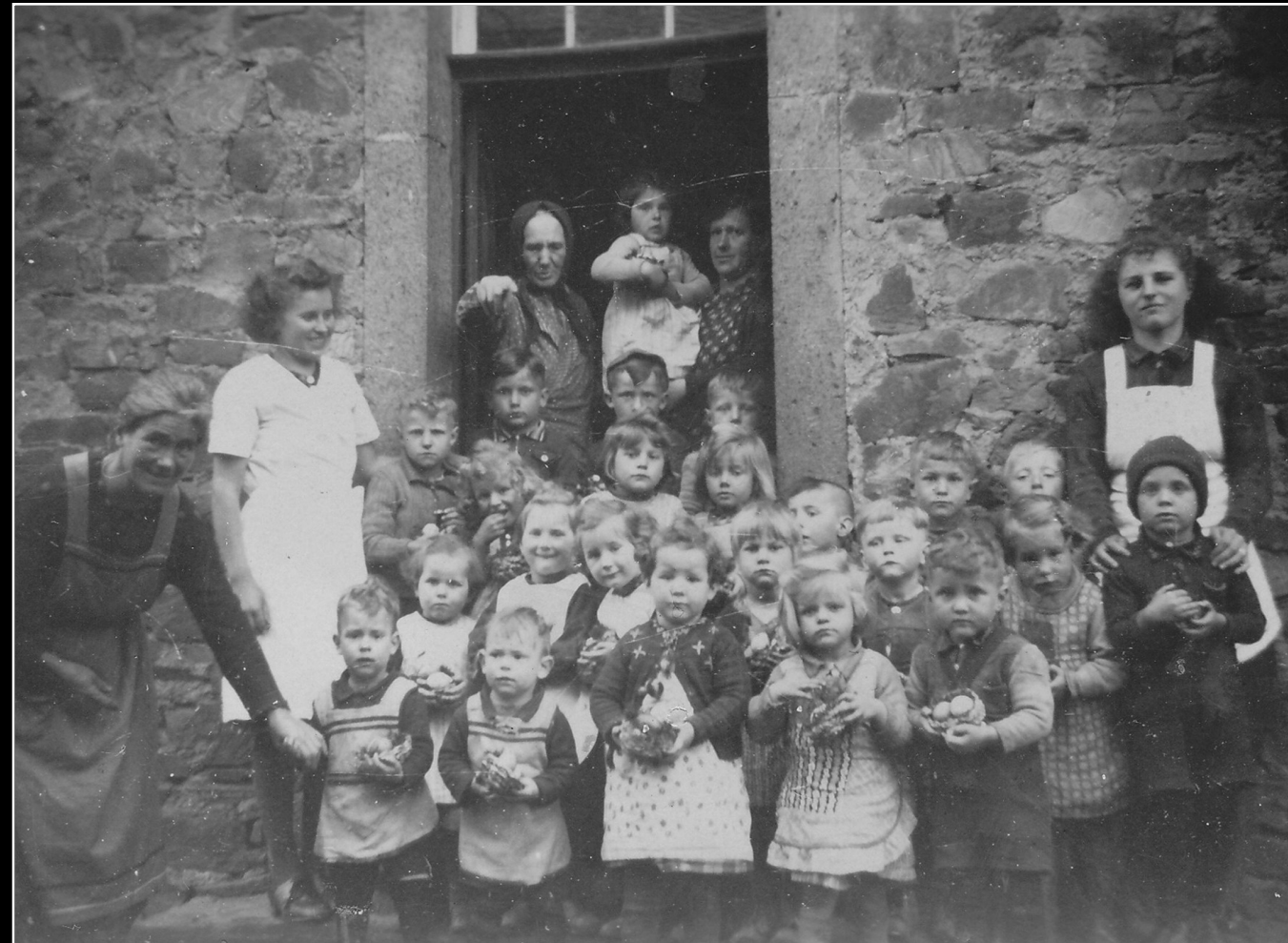
Kindergarten – 1944/45