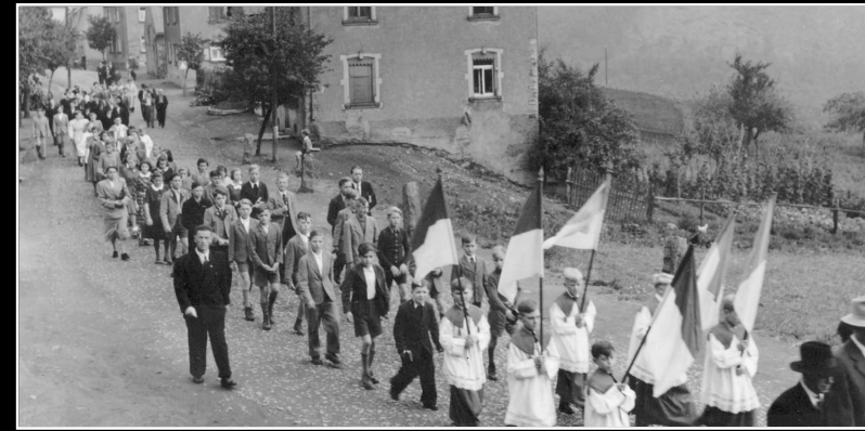
Feierlicher Gang zum Hochamt – 31.08.1952