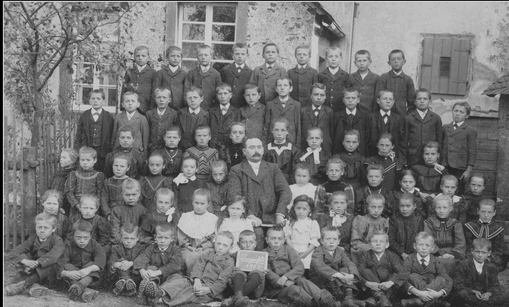
Klassenfoto – 1907