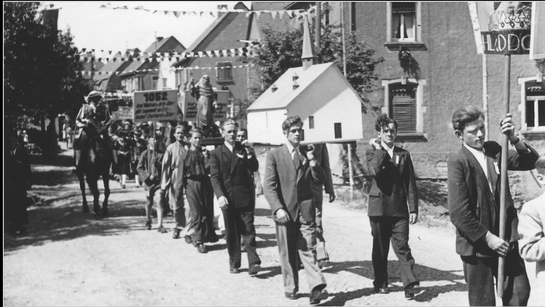
900-Jahr-Feier Langenfeld – 1952