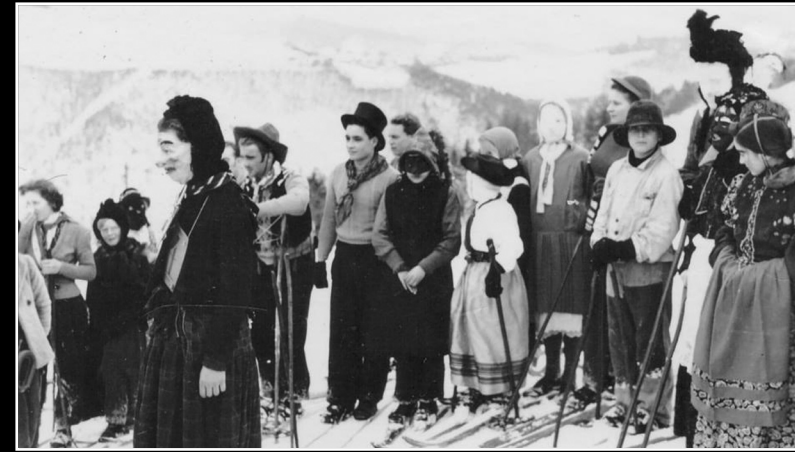
Skikarneval für die Hollandhilfe – 17.02.1953