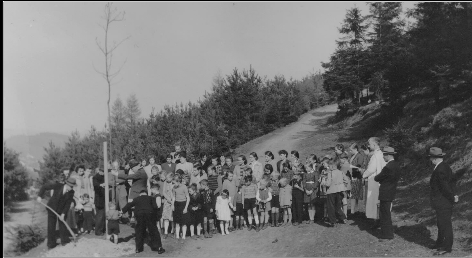
„Tag des Baumes“ – 19.04.1953