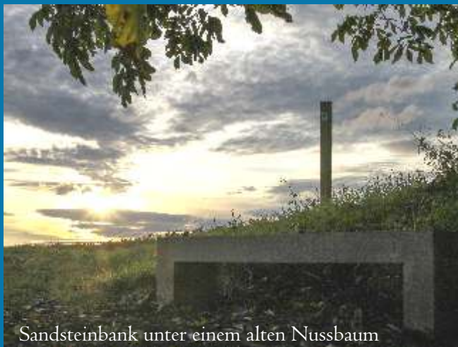
Sandsteinbank unter einem alten Nussbaum