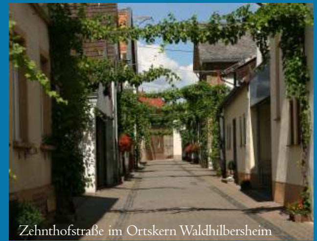
Zehnthofstraße im Ortskern Waldhilbersheim