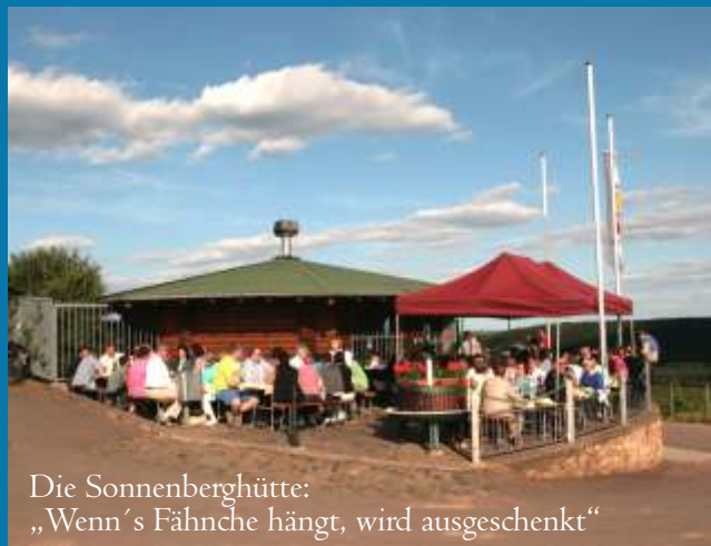
Die Sonnenberghütte: „Wenn´s Fährne hängt, wird ausgeschrieben“