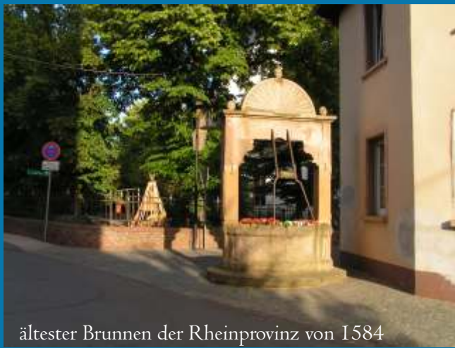
ältester Brunnen der Rheinprovinz von 1584