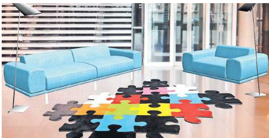
Augmented-Reality-Apps visualisieren Möbel im Raum und erleichtern so die Einrichtung.

Köln - Wer Möbel kauft, braucht Vorstellungskraft. Passt der Schrank auch wirklich in die Ecke? Wirkt das Regal nicht zu wuchtig oder die Kommode zu