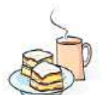
Kaffee & Kuchen