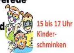
15 bis 17 Uhr Kinder- schminken