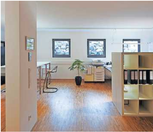
An Wohn- und Nutzräume wie ein Büro im Untergeschoss stellt der Gesetzgeber höhere Anforderungen als an reine Lagerräume.

Und wie muss man den Keller vor Wasser absichern? „Für den einfachen Lastfall, die Bodenfeuchte, reichen nach WU-Richtlinie eine 20 Zentimeter starke Bodenplatte und 20 Zentimeter starke Außenwände“, erklärt Wetzel. WU steht für „Wasserundurchlässige Bauwerke aus Beton“. |dpa