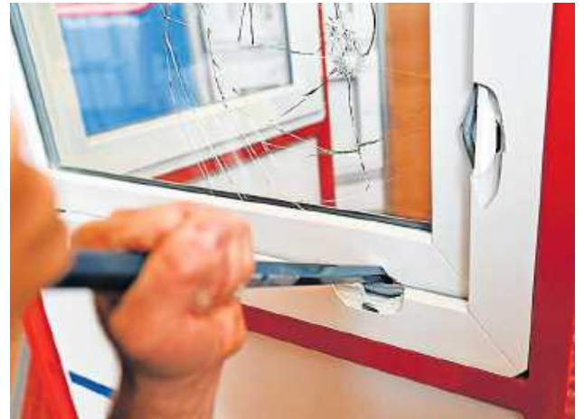
Aufhebeln mit der Brechstange: Viele Fenster lassen sich laut Experten mit einfachen Werkzeugen öffnen.

Das Nachrüsten kostet zwar Geld, und mancher kann es sich nur schrittweise leisten. Rieche rät allerdings, alle Fenster und Fenstertüren im Haus gleichermaßen gut abzusichern. „Einbrecher haben ein gutes Auge dafür, wenn irgendwo eine Sicherheitslücke klafft.“ |dpa