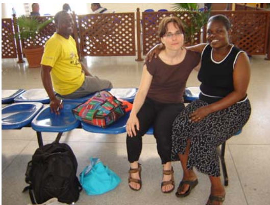
Abschied am Flughafen

Unser letzter Tag in Kenia klingt im Hotel aus, wo wir gemeinsam mit dem neuen/alten Vorstand zu Abend essen. Am Samstag um 10 Uhr 35 hebt unser Flieger vom Rollfeld des Flughafens Mombasa ab. Um 18 Uhr 20 landen wir in Frankfurt am Main.