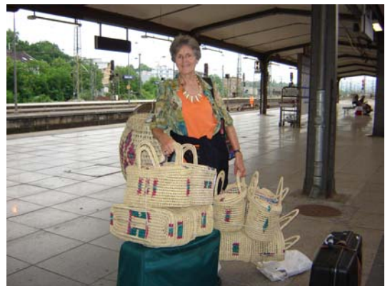
Ankunft in Frankfurt