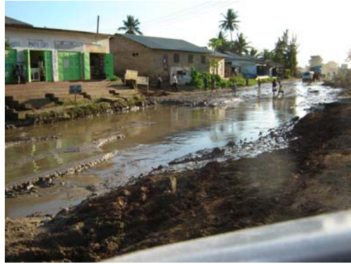
Mombasa / Slums