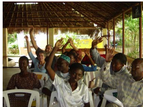
Wahl des Vorstandes