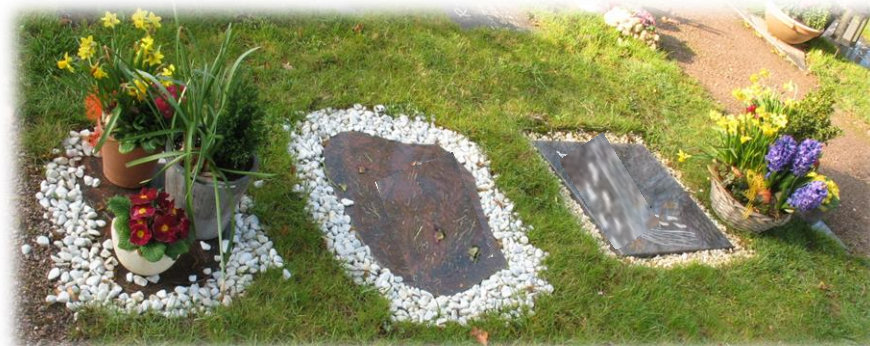
Unerlaubter Grabschmuck auf und um die Namensplatte herum (Blumen, Schalen, Figuren, Lampen, Leuchten, Kieselsteine usw.) führt zu zusätzlichem Pflegeaufwand der Rasenfläche.

Auf den Namensplatten ist kein Grabschmuck gestattet. Zur Gestaltung sind die Segmentplatten am Wegesrand vorgesehen. (FH-Satzung: § 23 Abs. 1B)