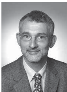
Von Gerd Reh

Der Vergleich einer aktualisierten Fortschreibung der Bevölkerung zum 31. Dezember 2012 auf Basis des Zensus 2011 mit der Fortschreibung auf Grundlage der Volkszählung 1987 zeigt, dass die Bevölkerung von Rheinland-Pfalz etwas kleiner, etwas weiblicher und im Durchschnitt etwas jünger ist als bislang ausgewiesen. Zudem wohnen hierzulande deutlich weniger Ausländerinnen und Ausländer als erwartet. In diesem