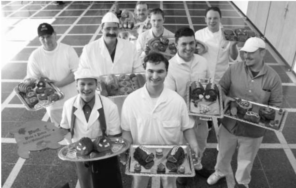
Kreativ und geschmackvoll präsentieren neun Fleischer ihre Meisterstücke. Mit Bestehen der praktischen Prüfungs- teile I & II haben sie einen wichtigen Schritt hin zum Meisterbrief geschafft.