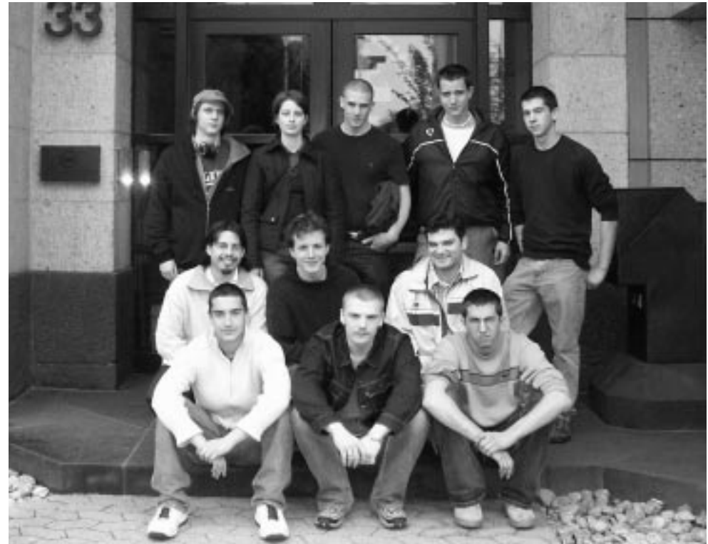
Elf Lehrlinge aus Wien lernten das Leben und Arbeiten in Handwerksbetrieben rund um Koblenz kennen und besuchten im Rahmen des Lehrlingsaustauschprogramms auch die Handwerkskammer.