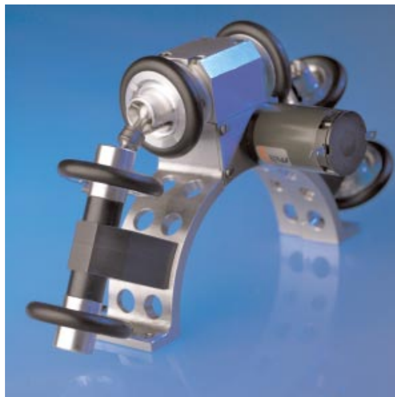
Detail aus dem Bewegungsapparat des Marsroboters, eine Präzisionsarbeit von R&W Maschinenbau aus Remagen.

Informationen und Anmeldung zum Aktionstag in der Schweißtechnischen Lehranstalt im HwK-Metall- und Technologiezentrum, Tel.: 0261/398-521, Fax: -988, E-Mail: schweissen@hwk-koblenz.de