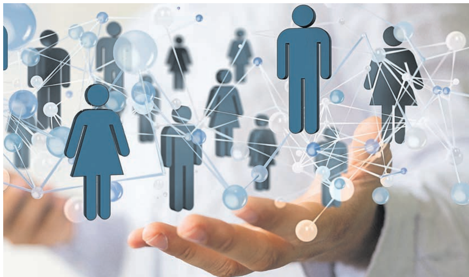
In Zeiten der Digitalisierung gewinnen auch Socialmedia-Kanäle wie etwa Facebook, Instagram oder Twitter an Bedeutung für den Arbeitsmarkt.

VERANSTALTUNG: Informationsabend zu den neuen Anforderungen am Arbeitsmarkt.