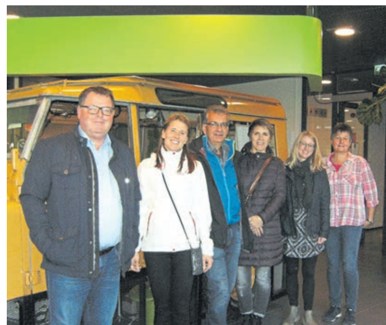
Zufrieden über den sehr interessanten Austausch in Finnland: Die Teilnehmer der Ausbilderreise nach Helsinki.

Infos bei der HwK-Mobilitätsberatung, Tel. 0261/398-337, mobira@hwk-koblenz.de.