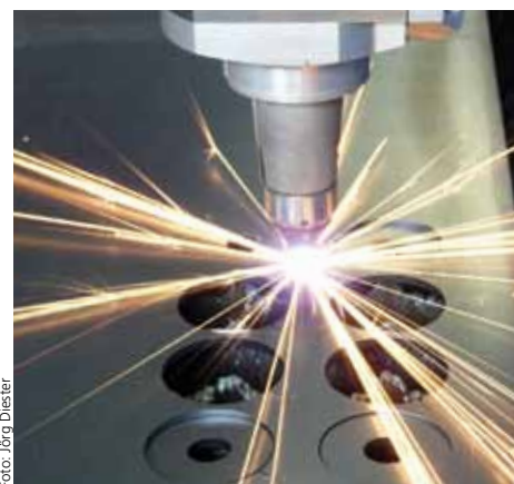
Für mehr Sicherheit beim Arbeiten mit Laser

Weitere Infos und Anmeldung bei den HwK-Beauftragten für Innovation und Technologie, Tel.: 0261/ 398-541, Fax: -988, E-Mail: bit@hwk-koblenz.de