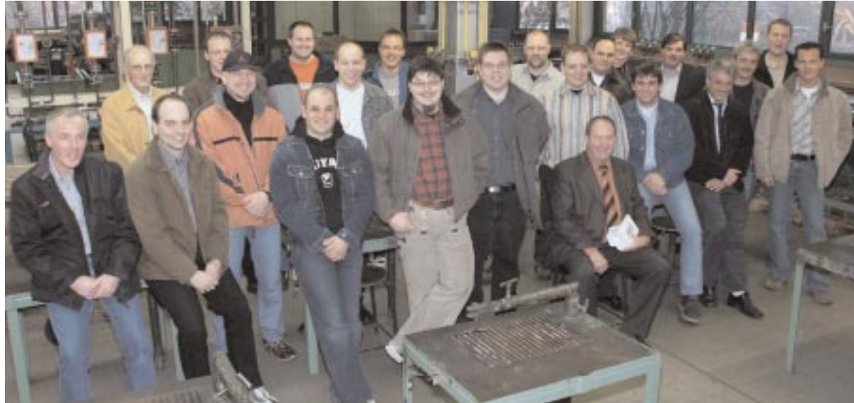
Die 20 Teilnehmer an der Qualifizierung zum Europäischen/Internationalen Schweißfachmann freuen sich mit ihren Ausbildern und Prüfern über die bestandene Prüfung.

20 Teilnehmer schließen Qualifizierung zum Schweißfachmann bei der HwK ab