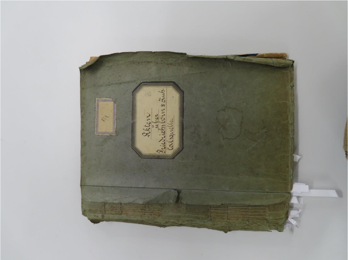
Beispiel 1: Akte: Vorher-Zustand: