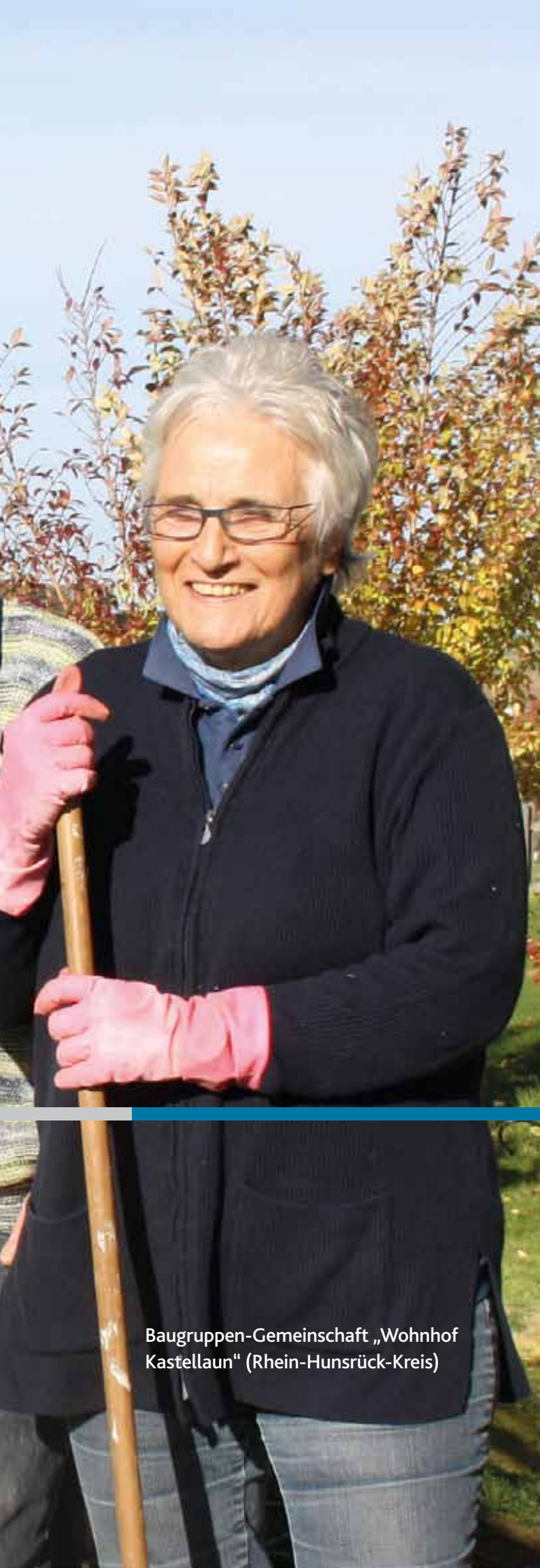
Baugruppen-Gemeinschaft „Wohnhof Kastellaun“ (Rhein-Hunsrück-Kreis)

In Rheinland-Pfalz ist eine große Bandbreite neuer Wohnformen entstanden. Die Beispiele auf den folgenden Seiten geben einen Überblick über diese Vielfalt, die Vorteile der unterschiedlichen Wohnformen und die Besonderheiten einzelner Projekte. Gemeinschaftliche Wohnprojekte mit abgeschlossenen Wohneinheiten und gemeinsam genutzten Begegnungsflächen bieten Jung und Alt Gelegenheit, sich mit den eigenen Fähigkeiten in eine aktive Nachbarschaft einzubringen. Wohn-Pflege-Gemeinschaften und andere innovative Wohnformen für ältere Menschen zeichnen sich durch ein hohes Maß an Selbstbestimmung, Teilhabechancen sowie Wahlfreiheit bei Pflege- und Betreuungsleistungen aus.