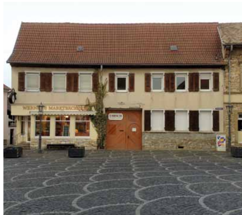
Wohnhaus der Wohngruppe vor der Renovierung

Darüber hinaus konnte ein Zusatzdarlehen über 25.000 Euro wegen Zuordnung der Gemeinde Gau-Algesheim in die Mietstufe vier bewilligt werden. Pro Quadratmeter förderungsfähiger Wohnfläche kann ein Betrag von 100 Euro, höchstens jedoch 25.000 Euro je Wohngruppe, gewährt werden.