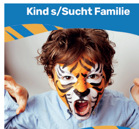
Der Flyer des MuTiger-Projektes

Es gibt zwei mögliche Schulungstermine: Entweder am 23. und 24. November oder am 9. und 10. Dezember, jeweils von 9 bis 16 Uhr. Ergänzend wird für beide Fortbildungsreihen im Frühjahr ein Seminartag zur Vertiefung angeboten. Eine Anmeldung ist unter: info@hausdergesundheit-trier.de möglich. Weitere Informationen unter www.hdg-trier.de/mutiger-gesund-aufwachsen/