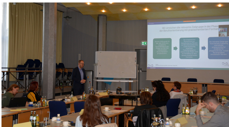
Die Teilnehmenden der Informationsveranstaltung zu care4future kommen aus den weiterführenden Schulen, den Pflegeschulen sowie den Einrichtungen der Pflege.

Für die Pflegeschulen und -einrichtungen sei es eine gute Möglichkeit, potentielle Nachwuchskräfte für den Beruf zu begeistern, so Wilker. „Aktuelle Studien sagen voraus, dass rund 500.000 Pfl-