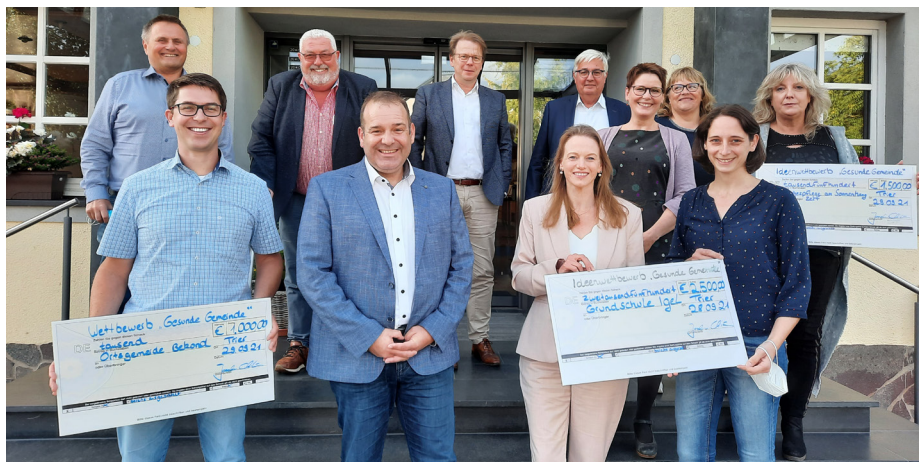
Die drei Preisträger erhalten ihre Auszeichnung sowie die Preisgelder vom Vorstand des Hauses der Gesundheit überreicht.

Sieger des Wettbewerbs ist die Grundschule Igel in der Verbandsgemeinde Trier-Land. Um die Gesundheit der Kinder zu fördern, stehen zukünftig Yoga-Stunden auf dem Stundenplan. Zudem ist ein Schulgarten geplant. Durch Vorträge zu den Themen „nachhaltige Ernährung“ und „foodsaver“ erlernen die Kinder den verantwortungsvollen Umgang mit Nahrungsmitteln und wie man sich gesund ernährt.