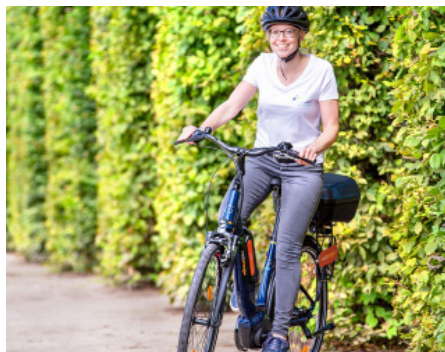
Mit dem Westnetz eBike unterwegs

Dienstwagen sind bei der Kreisverwaltung schon seit langer Zeit im Gebrauch. Ob Jugendamt oder Bauaufsicht – im Flächenkreis Trier-Saarburg müssen Mitarbeitende aus dienstlichen Gründen oft weite Wege zurücklegen. Für kurze Strecken, zum Beispiel zwischen den verschiedenen Standorten der Verwaltung in der Trierer Innenstadt, gibt es seit einem halben Jahr jedoch eine umweltbewusste und gesundheitsfördernde Alternative: zwei Westenergie eBikes.