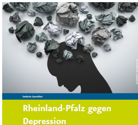
Eine Veranstaltungsreihe klärt über das Thema Depression auf.

Der Landkreis Trier-Saarburg unterstützt Initiativen und Aktionen rund um das Thema Depression. Um diesem und auch weiteren wichtigen Themen in der regionalen Versorgung von Menschen mit einer psychischen Erkrankung zukünftig noch besser gerecht werden zu können, soll der Aufgabenbereich der Psychiatriekoordination personell aufgestockt werden. Die Psychiatriekoordination ist der Leitstelle Familie der Kreisverwaltung Trier-Saarburg zugeordnet.