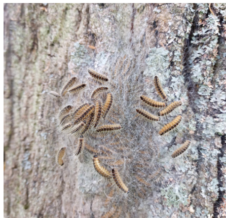
Eichenprozessionsspinner kann man an den langen Härchen erkennen.