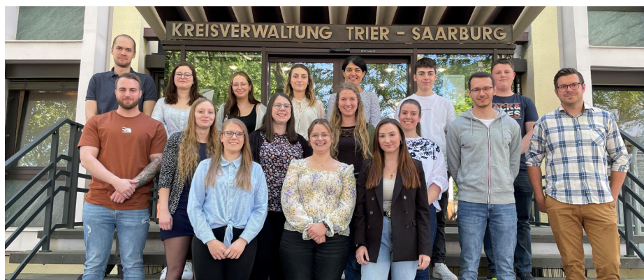
Das sind die Nachwuchskräfte der Kreisverwaltung Trier-Saarburg aus den Bereichen Verwaltung, Medizin und EDV.

Die Jugend- und Auszubildendenvertretung kümmert sich um die Anliegen der Nachwuchskräfte. Sie sind Ansprechpersonen bei Fragen und organisieren Treffen mit allen Auszubildenden. Daneben hat auch das Betriebliche Gesundheitsmanagement in der Vergangenheit immer wieder Gesundheits- und Ernäh-