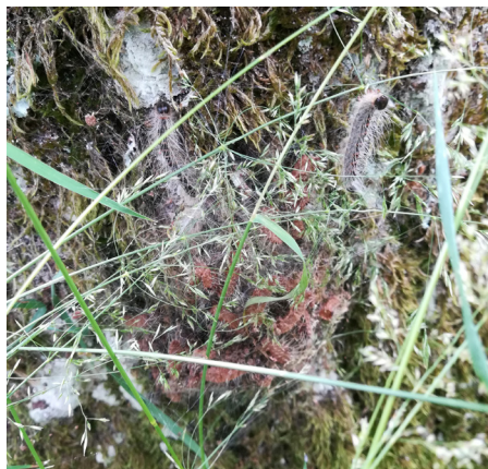
Ein Nest von Eichenprozessionsspinnern in Bodennähe