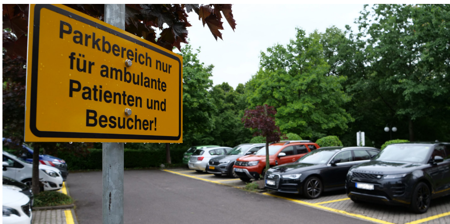
Ein Schild am Krankenhaus in Saarburg weist auf die Parkplätze für ambulante Patient:innen sowie für Besucher:innen hin.

und die Gastronomie werden geöffnet sein. Nach einem Großbrand 2018 wurde das Gebäude der Verbandsgemeindeverwaltung Saarburg-Kell rekonstruiert. Eine Besichtigung ist möglich am Samstag in der Zeit von 14 bis 19 Uhr und am Sonntag von 11 bis 19 Uhr.