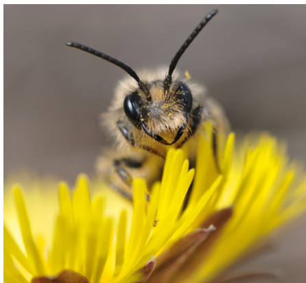
Hier sieht man eine Blattschneidebiene.